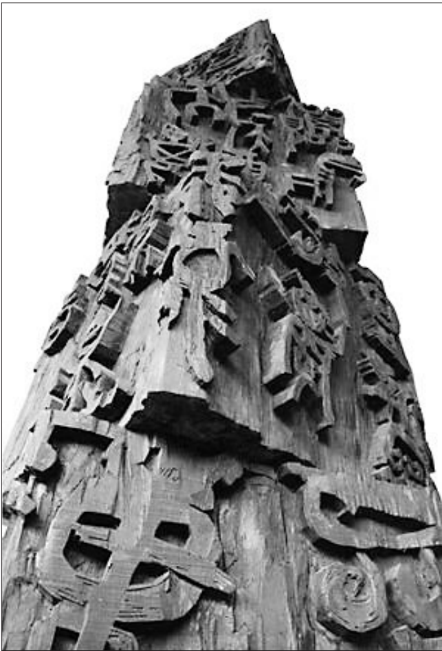
《擎天纬地》(书刻装置)