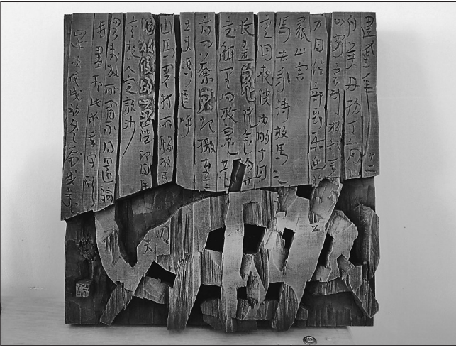
《典》入展第十一届全国刻字艺术作品展。