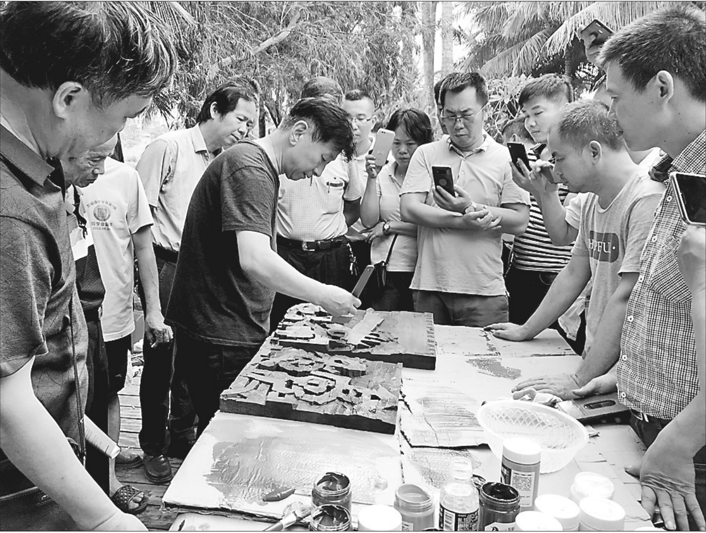
全省书刻公益培训班现场。