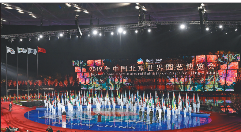
4月28日，2019年中国北京世界园艺博览会在北京延庆开幕。