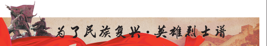
为了民族复兴·英雄烈士谱

5月12日,黄竞武在外滩中央银行的办公室内被国民党保密局特务绑架,押上警备车而去,从此不知下落。5月27日上海解放,6月2日,黄竞武等13位革命志士的遗体才在原国民党国防部保密局监狱所在地被发现。后经证实,黄竞武在狱中备受酷刑,于5月18日凌晨惨遭活埋,时年47岁。