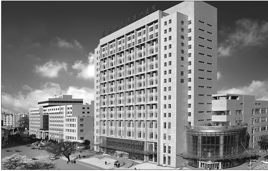
齐齐哈尔市第一医院。