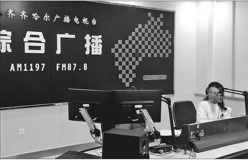
利用当地电台传播文明之声。