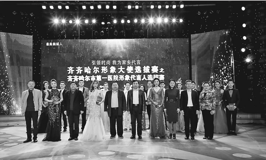
齐齐哈尔第一医院形象代言人选拔赛。