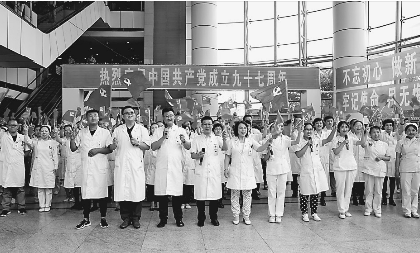
党建活动向社会传递正能量。