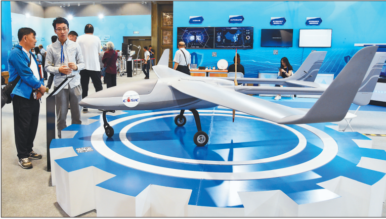
5月21日,在活动周主场,观众参观多用途无人机模型。 5月19日至26日是2019年全国科技活动周,今年的主题是“科技强国科惠惠民”。在北京的活动周主场,410个代表着我国科技创新最前沿成果的展项一一亮相。

取消高速公路省界收费站,主要是利用ETC技术,替代人工收费的方式,进一步提高车辆通行效率,降低物流成本。交通运输部公路局局长吴德金表示,ETC的推广应用全覆盖是能否如期实现取消高速公路省界收费站目标的关键因素,目前最紧迫的工作是大力推广普及ETC,开展