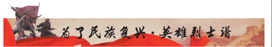
为了民族复兴·英雄烈士谱