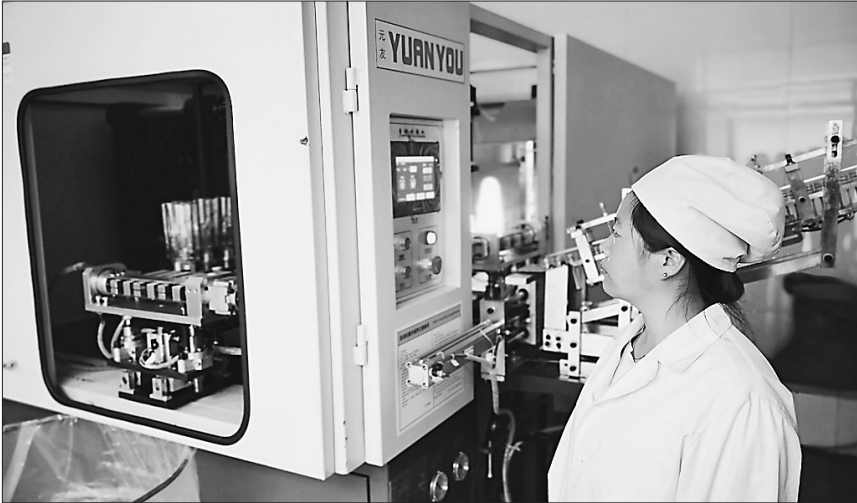
“东北王”矿泉水生产线。

2019年,他们立足加快培育新的经济增长点,加强产业项目的谋划储备,构建具有林区特色的现代林业产业体系,依托良好的生态环境和丰富的自然资源,围绕生态公益、产业经营、林业投资三个板块,加快实现发展模式由资源主导型向自主创新型、经营方式由粗放型向集约型、产业升级由分散扩张向龙头引领转变。围绕生态旅游、森林饮品、绿色种植、特色养殖、园林绿化五大基础产业,谋划生成精深化、绿色化、服务化、市场化“四化”产品,打造“统一大品牌、多