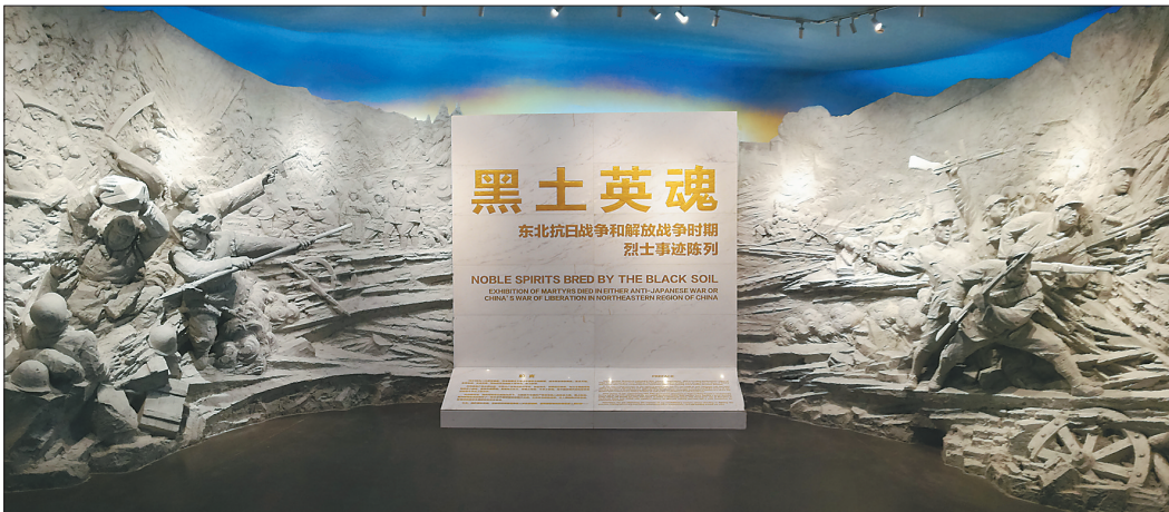
《黑土英魂——东北抗日战争和解放战争时期烈士事迹陈列》主题雕塑。