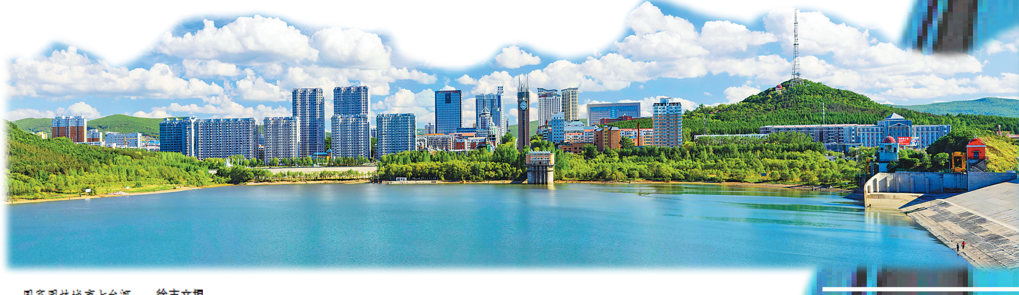
国家园林城市七台河。

当前,七台河正处在转型振兴发展的黄金期,蕴藏着宝贵的投资机会。推动七台河转型振兴“破茧成蝶”,其力已聚,其势已成,其时已至。