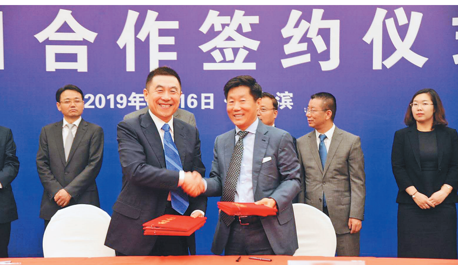
七台河市政府与北京泰银公司成功签约。