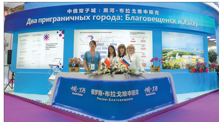
黑河—布市联合展台