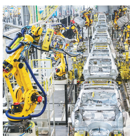
恒大天津生产基地焊装车间。

可以预见,随着国能93车型在天津生产基地量产下线,恒大在上海、广州、沈阳的各生产基地的建设投产也将加速提上日程,加上恒大已具备量产能力的瑞典特罗尔海坦基地,恒大已为其后续推出更多蕴积恒大基因的新车型提供了产能保障。