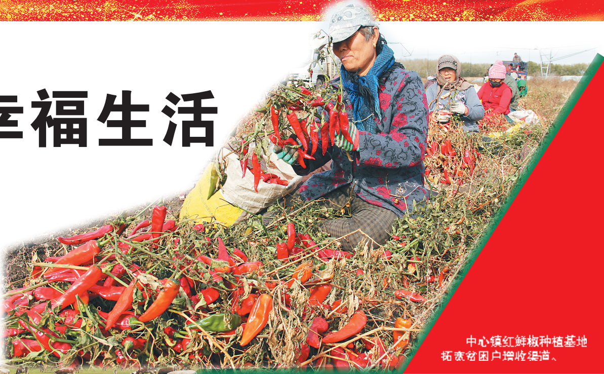
中心镇红辣椒种植基地 拓宽贫困户增收渠道。

近年来,依安县立足县情实际,确定了全县经济社会发展“35810”总体工作思路,即坚持陶瓷、食品、生化“三大”产业发展定位不动摇,唱响北国瓷都、中国五色土(北方紫砂)之乡、中国白鹅之乡、中国紫花油豆角之乡、“亮心大姐”家政服务“五大”品牌。扎实推进脱贫攻坚精准化、规模农业产业化、产业项目集群化、特色产品电商化、城乡建设生态化、民生服务便利化、基本公共服务均等化、作风建设常态化“八化”战略;坚决打好扶贫脱贫、特色农业结构调整、立县财源培育、深化重要领域改革、大众创业、污染防治、农村基础设施改造升级、陶瓷文化旅游开发、防范化解重大风险、整顿作风优化营商环境“十大”攻坚战,县域经济社会持续健康发展。