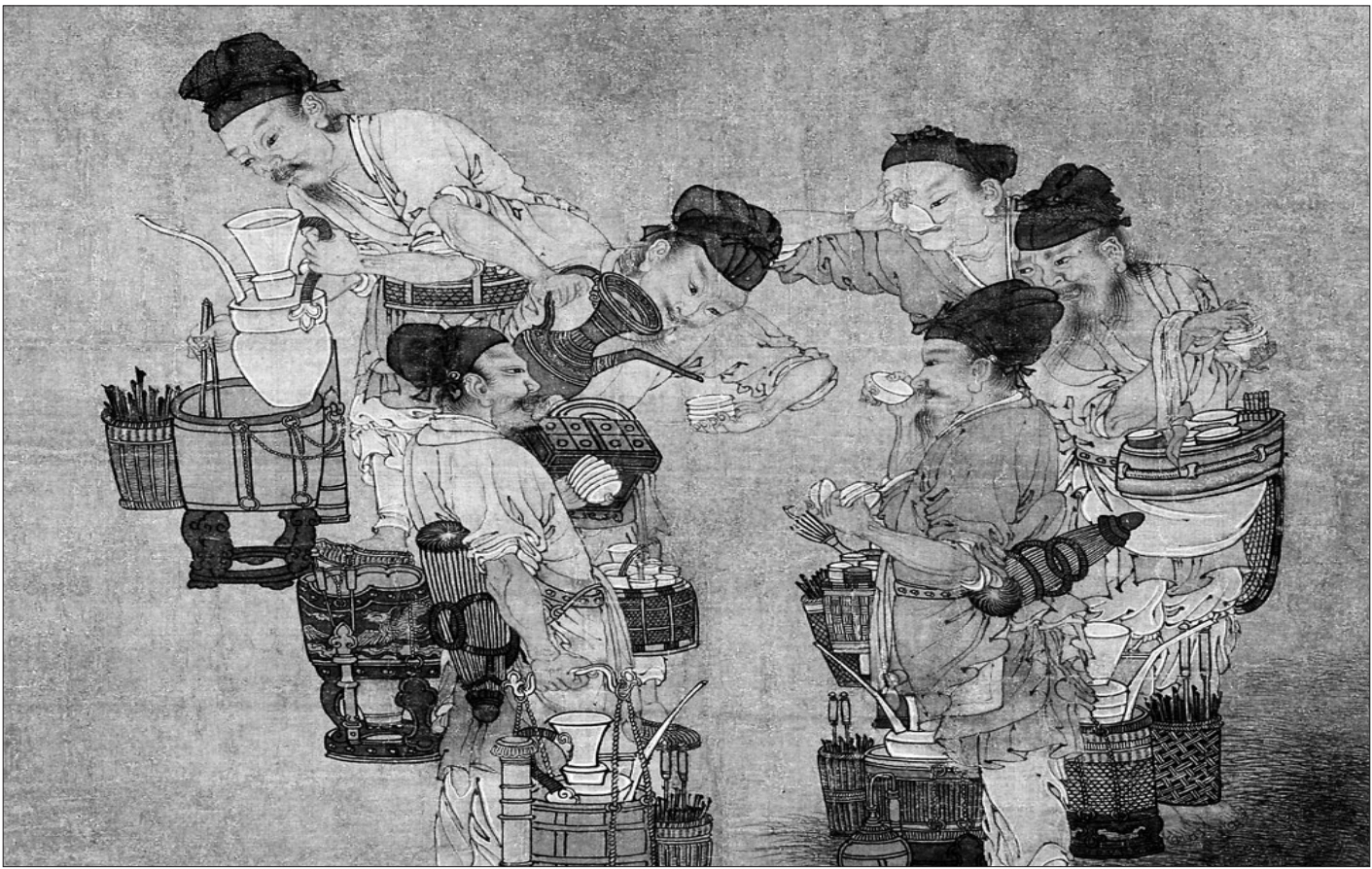
南宋《斗浆图》。

茶,兴于唐而盛于宋。中国茶文化也因此宋代上升到了无所不臻的至高境界。宋代茶文化堪称精绝,不仅拥有着淡雅的文人 之气,而且还注入了丰富的生活情趣。宋代文学家范仲淹的一首《和章岷从事斗茶歌》,将宋代那遥远而富有浓郁生活气息的斗茶盛况描绘得淋漓尽致。黑龙江省博物馆的“重量级”文物——南宋《斗浆图》,古朴典雅,纯朴自然,生动再现了宋代普通百姓在街市斗茶的热闹场景,让观者如临其境。