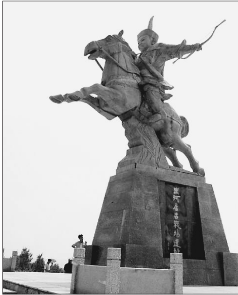
出河店之战古战场雕像。

皇帝昏庸,朝廷腐败,令完颜阿骨打无法忍耐,遂产生了反叛之心。于是,他筑城池,招兵买马,经过两年的准备,统一了现在的松花江流域。一天,阿骨打问计于部将:“辽人骄横自大,并且得寸进尺地损害女真族利益,又强迫完颜部以外的部族防范和钳制我们。我想先剪除辽国监视和控制我们的北疆前哨之重镇,以此来张扬我们的军威,然后进伐辽国,如何?”完颜娄室说:“辽人内外交困,就像强弓射出的箭,已经到了末了。可以攻伐它!”听了女真“战神”的这番话,阿骨打才下了首先夺取宁江州的决心。在这场战役中,完颜娄室带领年仅十七岁的儿子完颜活女率先登城,破城,完颜娄室父子勇猛无敌。