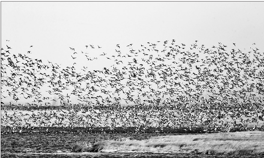
候鸟春季返回挠力河保护区的场景。