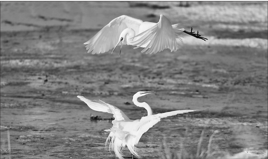
千鸟湖冰雪未融大白鹭回归的场景。