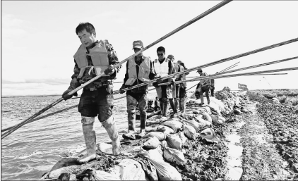
二九一勇士奋战在抗洪大堤。

面对灾情,北大荒农垦集团总公司(农垦总局)党委时刻把防汛工作放在心上。党委书记、董事长、农垦总局局长王守聪多次要求加大防汛工作力度,按照省委省政府要求落实落靠各项措施,统筹受灾农场给予一定的支持。8月5日起,集