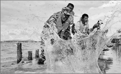
大兴农场抗洪勇士战洪渡。