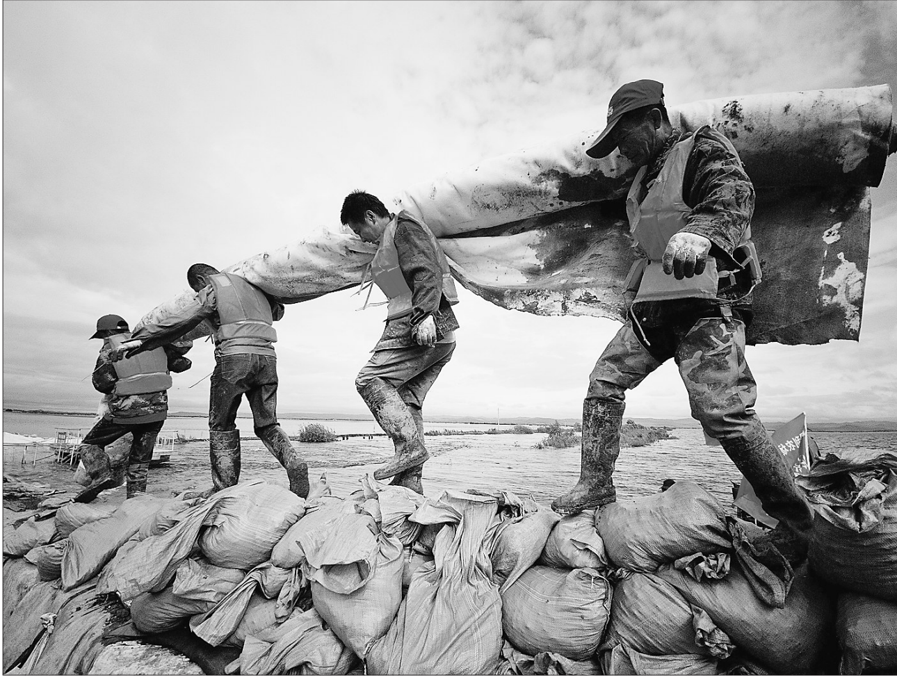
齐心协力,阻击洪水。