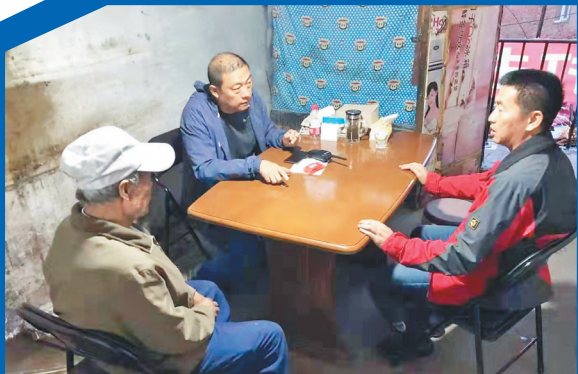
工作人员走访棚户区住户。

8月31日,哈尔滨市道里区棚改项目再次交上满意答卷。用时仅12天,占地8.85万平方米的武威路铁顺街棚改项目910户居民全部实现签约撤离。时间为证,道里区再次刷新主城区国有土地房屋征收的最快速度。