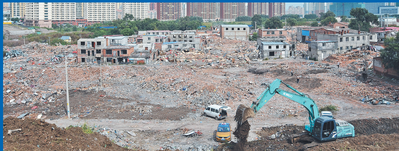
净地后的武威路铁顺街棚改区域。