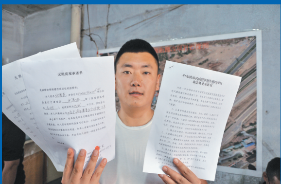
创新实施工作人员及住户双承诺。