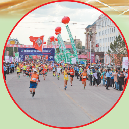
2019中国北极漠河极昼马拉松赛。

漠河市突出重点、攻克难点,打造亮点,紧扣目标任务,全力以赴抓好重点项目建设,强化高质量发展支撑。今年以来,向上争取资金突破13亿元,229个项目纳入国家重大项目库,24个项目纳入全区“双五十”。招商引资新签约项目2个,签约额2.07亿元;翅冀温泉酒店开工建设。漠河机场改扩建可研、选址意见书已完成;瓦西公路完成工程量的89%;大林河大桥改建工程进入收尾阶段;二林河治理、阿木尔河治理工程开工建设,石林景区公路、棚改配套、“三供一业”维修改造等项目稳步推进。