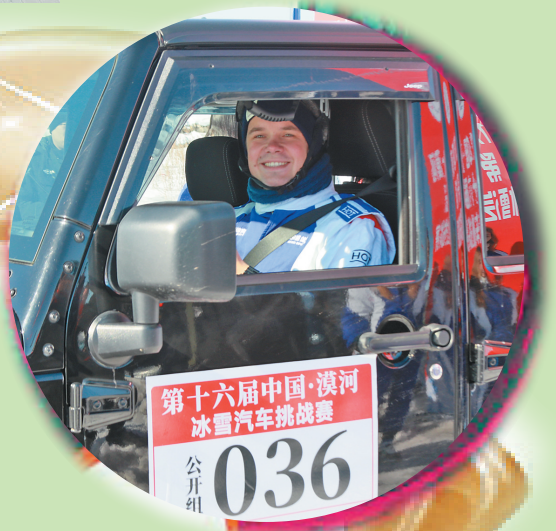
参赛的俄罗斯车手。