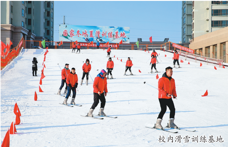
校内滑雪训练基地

鸣谢：对在学校发展过程中给予关心和支持的各级政府、领导、各界友人、校企合作伙伴、各高校同仁、广大校友们，表示衷心的感谢！