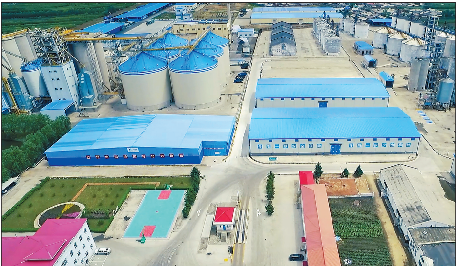
粮食加工企业——益海粮油。