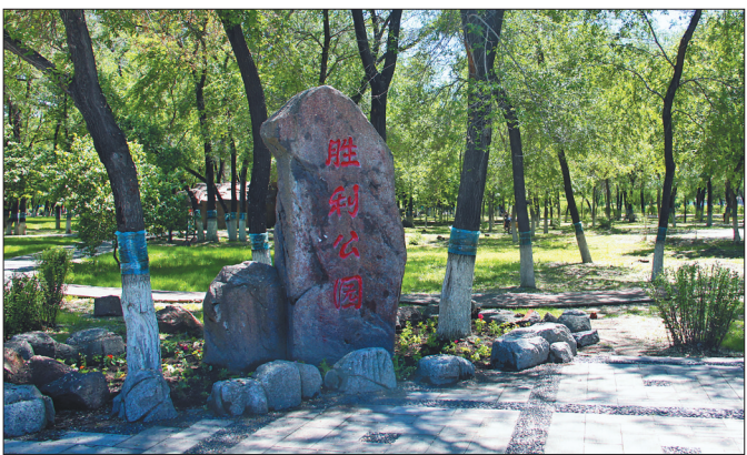
绿荫掩映的胜利公园。

坚持以产兴城、以城带产、产城融合、城乡一体的发展思路,五年内实现国家级产城融合示范区建设目标。一是推进东兴城市建设,不断优化现代商贸流通业,重点引进SOHO 裙房商业中心,打造东兴城商业圈。二是推动区域联动发展,优化城区空间结构,统筹区域要素配置,做好征地拆迁等服务工作。引导企业围绕市高新区发展配套服务业,开展专业化分工协作,形成关联企业和上下游企业链条。