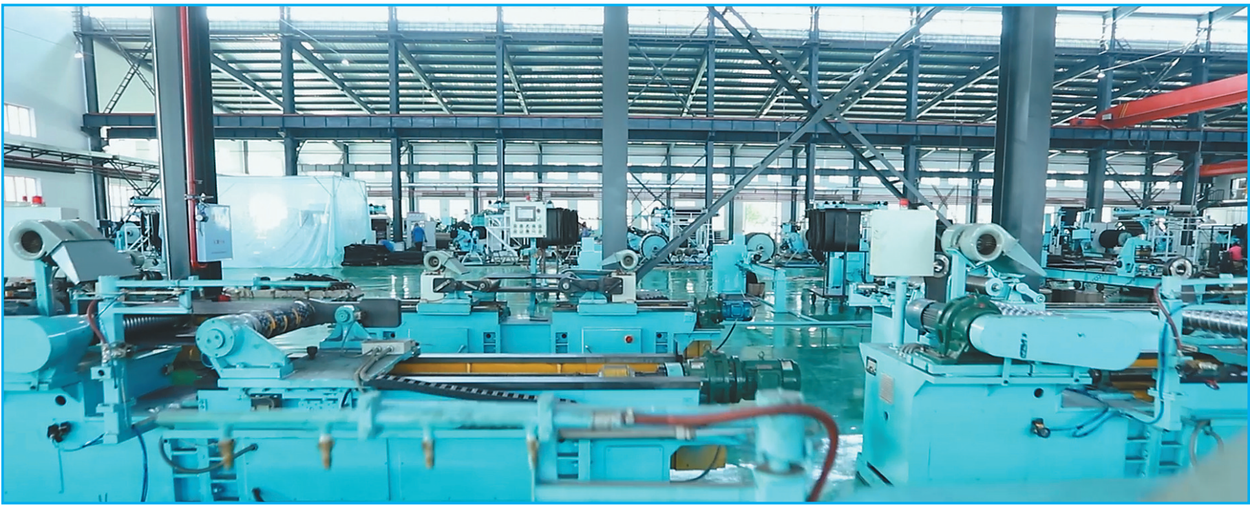
现代化的生产车间。

三是推动园区快速发展。进一步完善东风区工业园区和北方寒地水稻种子研发交易园区布局和功能,加快园区配套设施建设步伐,为项目建设提供平台。打造东兴城市建设投资有限公司的融资平台,解决产业项目建设融资难问题。我们牢牢抓住了发展这个第一要务,经济发展的质量和速度明显提升,持续发展有后劲,完成各项工业指标的同时,确保了我市重大项目的顺利实施。