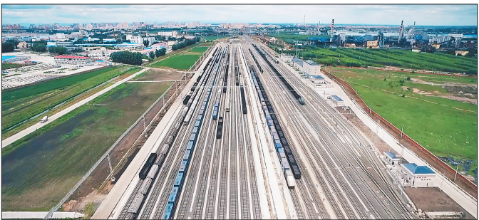
丰富的物流交通条件。

充分发挥区位优势和水陆空交通便捷优势,围绕“一带一线一园”打造现代物流聚集区。大力发展现代物流产业,推进国际物流园项目,做好公铁物流园、浦东物流园货运配套及服务业项目,推动公路、铁路物流业发展,着力打造特色优势产品出口和商贸物流集散基地。围绕“一带”做强对俄物流,依托并积极融入“龙江丝路带”哈佳双同产业集聚带建设,推进国际铁路集装箱联运项目,打造特色优势产品出口和商贸物流集散基地,大力发展了对俄贸易。