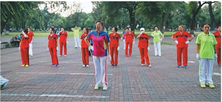
市民在公园内跳起欢快的广场舞。

“初心永不忘,使命勇担当。”东风区要守初心、担使命,找差距、抓落实贯穿工作始终,在解放思想中转变观念,抢抓机遇,切实把解放思想的成果转化为推动高质量发展的强大动力,为东风区全面振兴全方位振兴贡献力量,以优异的成绩向新中国成立70周年献礼。