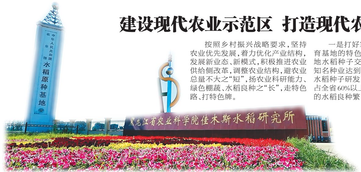
坐落在东风区的水稻研究所。

三是打造生猪产业链的特色牌,推广“龙头企业+专业合作社+养殖户”发展模式,努力打造“生产、加工、销售”的生猪产业链。力争引进双兆集团,推进天农浩然生猪屠宰项目投产达效。四是打好绿色乡村产业游特色牌,打造“红力村——西太平村——建设村”乡村旅游路线,实现“春观雕,夏赏花,秋品稻,冬戏雪,摘绿色果蔬,品农家饭菜”的美好愿景。现代农业示范区新体系的构建推进了美丽乡村建设,通过“打绿色牌、走特色路”,显现出东风区现代特色农业蓬勃的发展活力。