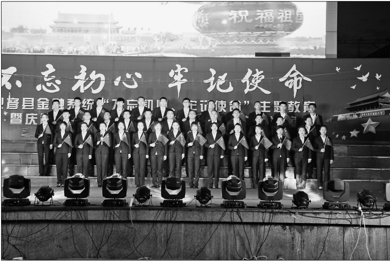
日前,巴彦县“不忘初心,牢记使命”主题教育暨庆祝新中国70华诞汇演举行。活动由该县县委组织部、宣传部和中国人民银行巴彦支行主办,展示了该县金融系统朝气蓬勃、积极向上的精神面貌。 张晓权 王柠 本报记者白云峰摄

为确保道路交通安全,木兰县交警大队针对“两客一危”(营运客运、旅游客车、危化品车辆)等重点车辆,着重查处机动车涉牌、涉证、超员、超载、酒驾、毒驾、违法载人、不系安全带等交通违法行为。同时对过往车辆开展道路交通安全宣传,教育广大驾驶人遵章驾驶,文明出行。此次陪同执法过程中共检查车辆5台次,发现违法行为1起。