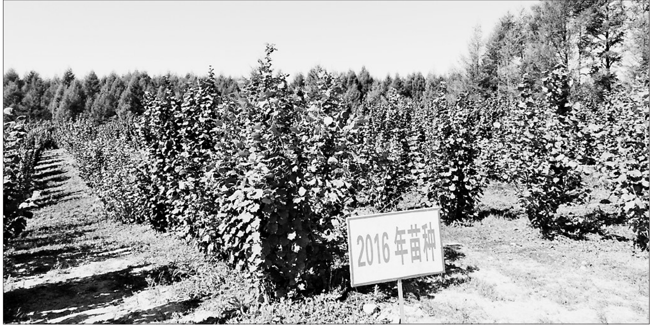
通河县三站镇千亩大果榛子示范基地。