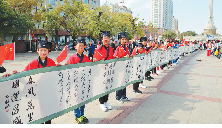
佳木斯市开展“百米长卷共书中国梦”书法活动。