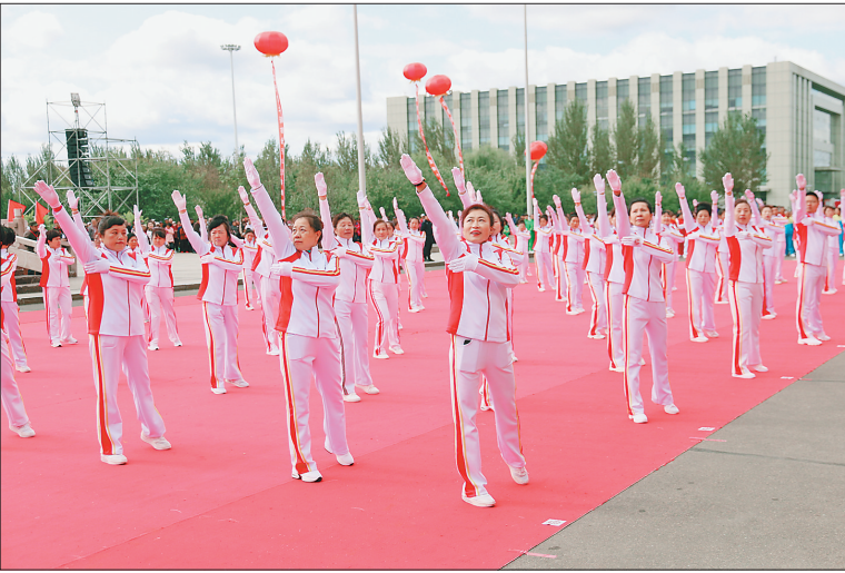
近日,“我和我的祖国”——文化新生活全国广场舞展演活动暨佳木斯快乐舞步会演活动在佳木斯市举行。活动以庆祝新中国成立70周年为主题,数千名群众欢聚一堂,高歌劲舞祝福祖国,大型团体表演喜迎祖国祝福祖国点赞美好生活。

本次鸡蛋“保险+期货”项目的签订,为养殖业“保险+期货”项目保障农民收益的功能起到了示范作用,为后期扩大试点规模和范围奠定坚实基础。中信期货、安华保险两家公司将继续加大合作力度拓展新险种,开展多领域、深层次全方位的合作创新“保险+期货”业务模式。该项目在4月初进入规划阶段,先后经过保单设计、保费测算、系统试行的过程,历经半年时间,项目正式在汤原县落地,这也是安华保险公司与佳木斯市政府签订战略合作协议中的一个主要内容。据了解,项目投保蛋鸡共计11万只,承保鸡蛋约130吨,保险期限为1个月,保费共计4万元,项目保费全部由中信期货为养殖户缴纳。