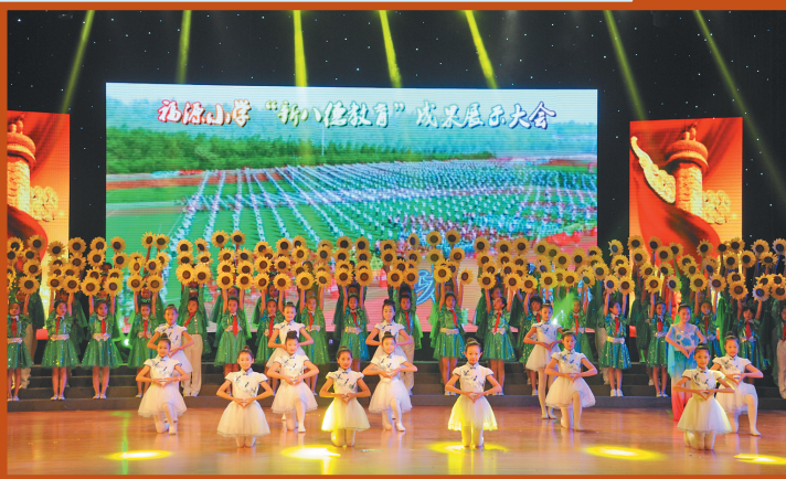
实验小学学校“新八德”活动展示。

着力扩大开放合作,加速打造开放环境、加速构筑开放平台、加速融入开放格局。肇东通过坚持对内对外开放“并举”、引资引技引智“并重”、请进来走出去“并行”,努力实现更深层次、更高水平的开放发展。今年上半年,外贸进出口总额完成16.4亿元,同比增长61.2%。抓住建设哈尔滨新区有利机遇,积极融入服务哈尔滨都市圈,目前已形成与哈尔滨滨水陆空相连的立体交通体系,加快实现与哈尔滨同体同业同城发展。先后引入黑龙江省危险废物处置中心、大庄园肉业等哈市溢出产业,为打造与哈长城市群经济圈优势互补的产业集群开辟了全新道路。