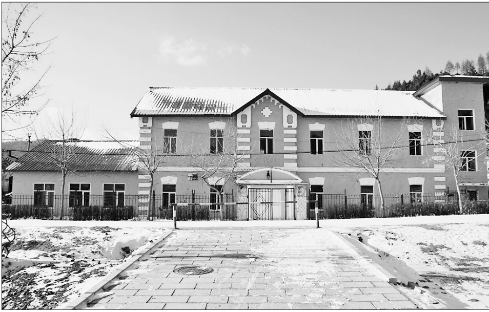
横道河子机务公寓旧址东侧。

中东铁路建筑群——横道河子机务公寓旧址,位于黑龙江省海林市横道河镇老街社区学字路127号,建于1900—1935年,二层俄式楼房,建筑面积480平方米,原为专供铁路司乘人员倒班休息的地方。