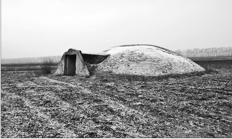
侵华日军在勃利修筑的荣光飞机场防御工事。

侵华日军东北要塞—勃利西山仓库遗址位于黑龙江省七台河市勃利县勃利镇铁西街西1500米处的山岭中,地理坐标东经130°31′07",北纬45°44′59",海拔237.6米,东西长885.5米,南北长1025.5米,占地面积约86.75万平方米。该遗址于1993年被发掘,遗址平面呈不规则椭圆形。