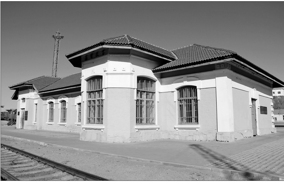
富拉尔基火车站旧址正面(南)。

中东铁路建筑群——富拉尔基火车站旧址,是中东铁路干线从满洲里入境,经过海拉尔、扎兰屯、富拉尔基、昂昂溪、哈尔滨直至绥芬河出境,沿线中重要军事运输的中转站和停靠站。中东铁路沿线共设站舍33个,富拉尔基火车站旧址是现存完好为数不多的一处旧址。位于富拉尔基铁路货运场内,南距滨洲铁路线约15米,建筑面积360平方米。