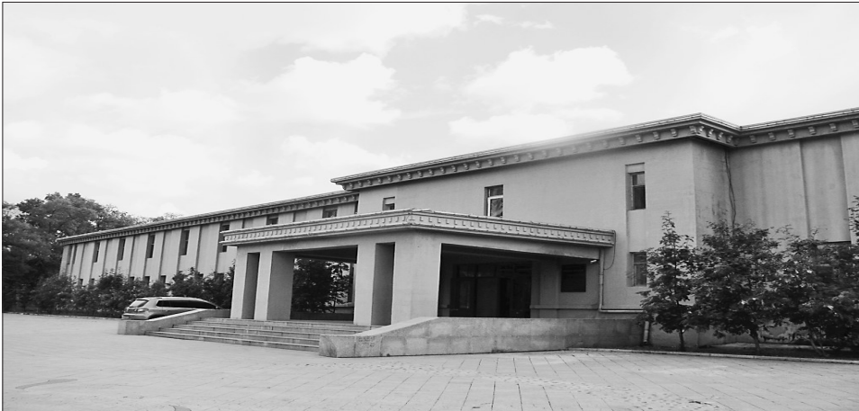
中共黑龙江省工作委员会旧址正面。

旧址为黑龙江省领导核心和各党政机关主要集中办公处,也是目前黑龙江省解放战争期间保存最为完好的省级机关办公场所,它见证了党中央“向北发展,向南防御”战略和中央东北局、黑龙江省委各项工作决策的实施,承载了我党创建巩固黑龙江根据地的艰苦奋斗历史和革命斗争经验,传承了伟大的延安精神和源自延安的红色基因,是宝贵的精神财富。