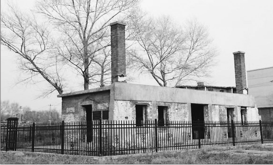
日本侵华日军第516部队总部旧址。

日本侵华日军第516部队总部旧址,发现于1982年。位于黑龙江省齐齐哈尔市铁峰区南浦路与曙光大街交汇处拐角位置,由现存的一栋平房、一通方形烟筒、一座方形岗楼和一座断墙残壁建筑及四栋房基址组成,现存占地面积3.1万平方米。