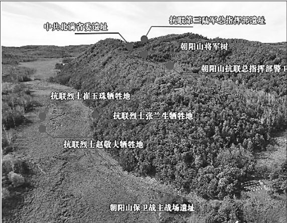
朝阳山东北抗联三路军总指挥部及密营遗址全景。

朝阳山东北抗联第三路军总指挥部及密营遗址是东北抗日联军第三路军战斗的主要根据地,是中共北满省委所在地,是抗联后期进入艰苦斗争最典型的密营遗址,在抗击日本侵略者方面发挥重要作用,是一定历史时期的见证,现已成为爱国主义教育基地、国防教育基地和红色旅游景区,被誉为“东北井冈山”,具有重要的历史价值。