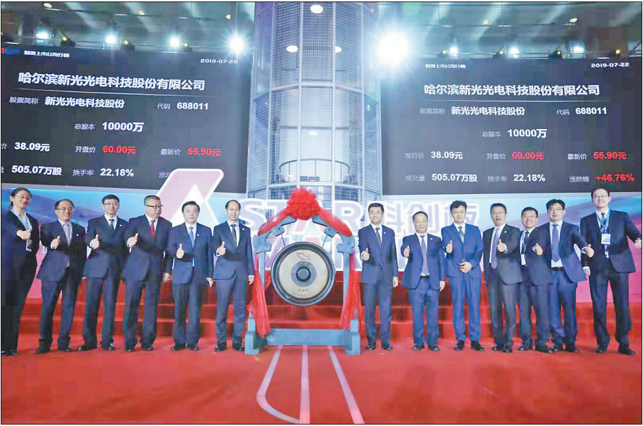
新光光电科创板首批上市。