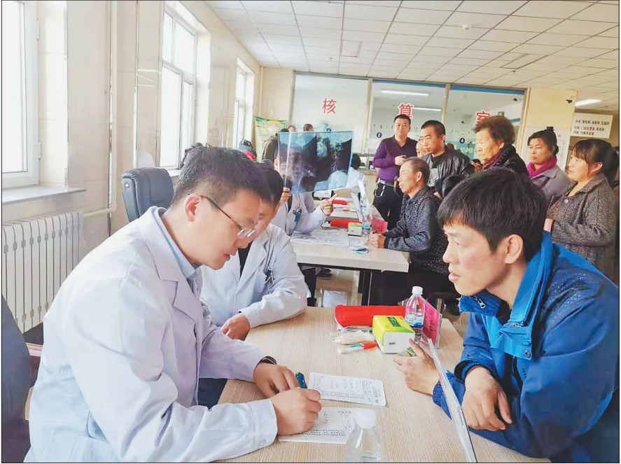
我省青年中医专家团队到绥棱进行健康扶贫义诊活动。