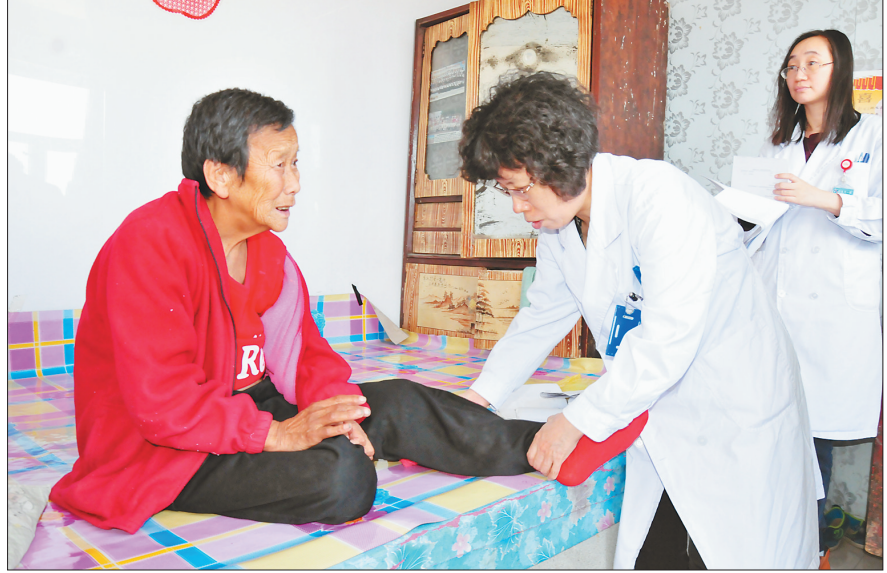
哈医大一院助力健康龙江精准扶贫攻坚基层服务专家团队走进贫困村义诊送健康。