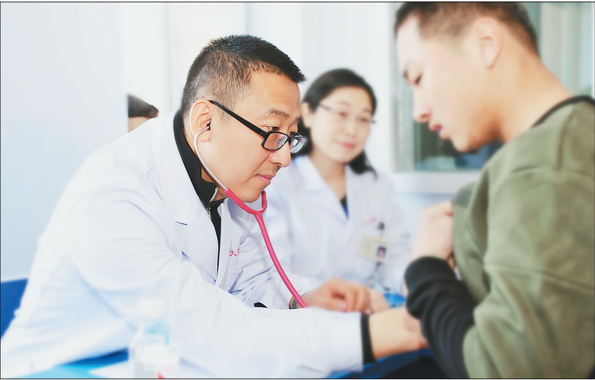
哈医大四院的专家们在巴彥县为百姓义诊。

龙江充满人间大爱的健康扶贫工作连续3年获得国家卫生健康委的通报表扬;我省的明水县、汤原县在健康扶贫工作中表现突出受到全国通报表扬。在2019年全省脱贫攻坚表彰中,来自全省卫生健康委系统的5名先进个人获得贡献奖,黑龙江明水康盈医院和省卫生健康委医政医管处获得组织创新奖。