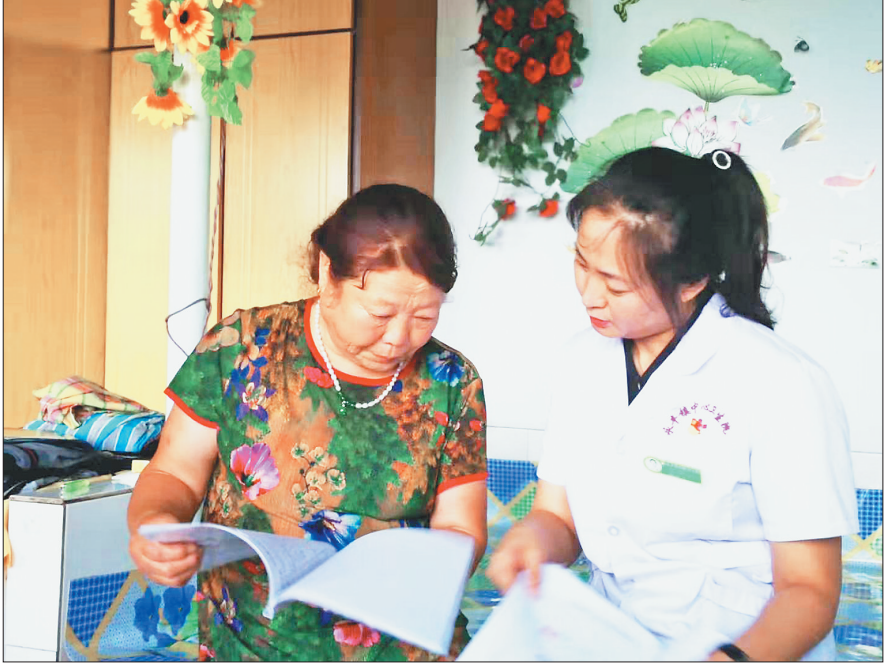
明水永丰卫生院工作人员到贫困户家核对健康扶贫台账。