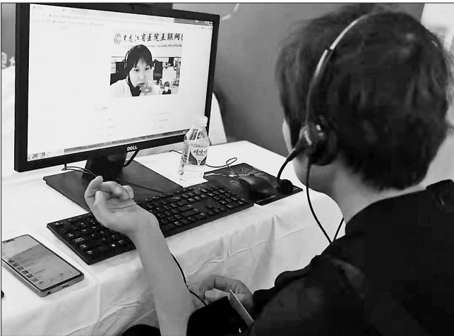
在首届黑龙江中医药产业博览会上,患者正在体验使用黑龙江省医院互联网医院进行远程网上问诊。