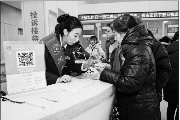
黑龙江省医院工作人员指导就诊患者使用该院掌上医院挂号,生成电子健康卡。

为落实“看病不求人”行动,方便患者就诊,哈医大四院在2019年率先引进“人脸注册识别系统”,只要在该系统注册成功,就可以实现人脸识别缴费、人脸自助挂号等服务。目前在门诊收款处,患者可进行“支付宝刷脸”缴费,操作简单,流程不到20秒。