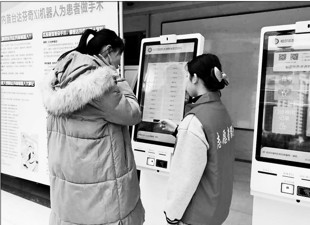
哈医大四院的志愿者正在指导患者如何进行预约挂号。

据介绍,“全时空”门诊让就诊突破了时间和空间的限制,只要医生在医院,患者就能挂号,无论在门诊、病房、办公区,医生都可以为患者问诊、开方、诊治。这一举措不仅能够合理地调配诊疗资源,还可缓解看病难现象。