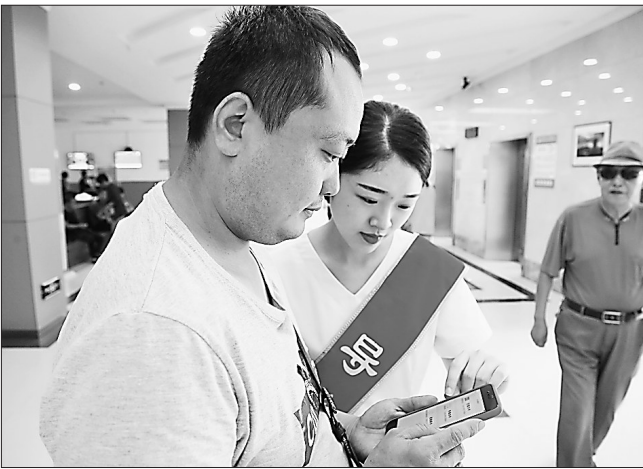
导诊护士指导患者使用电子卡就诊。