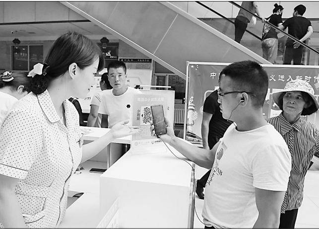
患者通过智慧医院平台就诊。