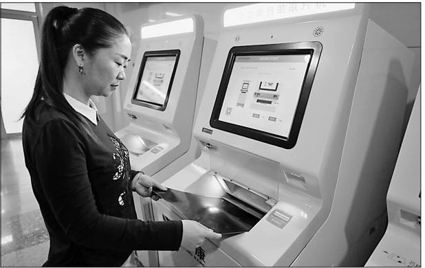
患者在大庆龙南医院CT室通过自助机取报告。

值得一提的是,互联网医院还设置了电视医院,在自家电视机上就能直接进行复诊问诊。该功能主要针对慢性病、常见病病患开展复诊,这样免去患者舟车劳顿,提高了看诊效率。黑龙江省医院是该平台首批开发完成并入驻的电视医院,该项技术和服务是我省乃至全国的首创。