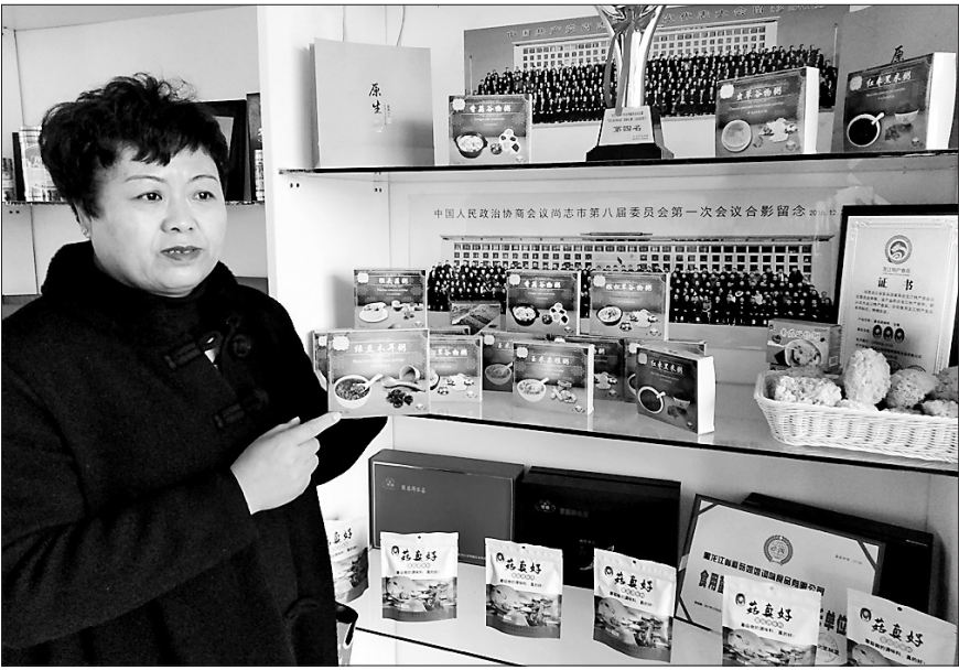
尚志蘑菇姐姐调味食品公司展示新产品。