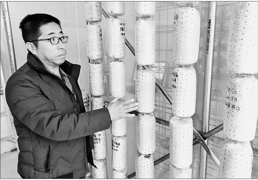
珍珠鑫宝菌业公司培育新菌种。