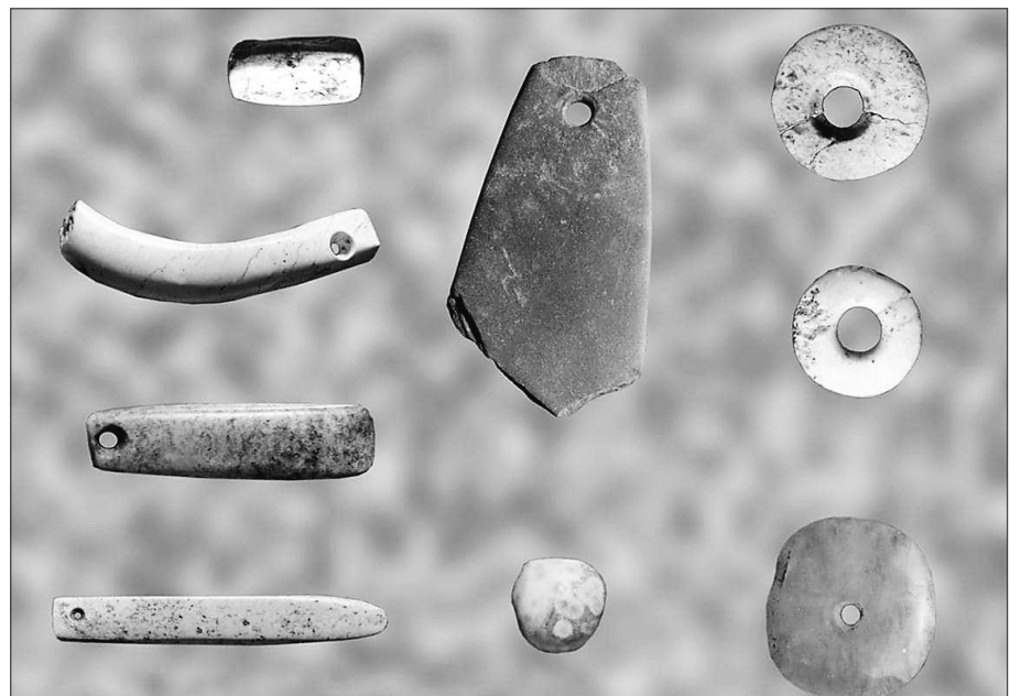
小南山遗址出土的穿孔玉器。