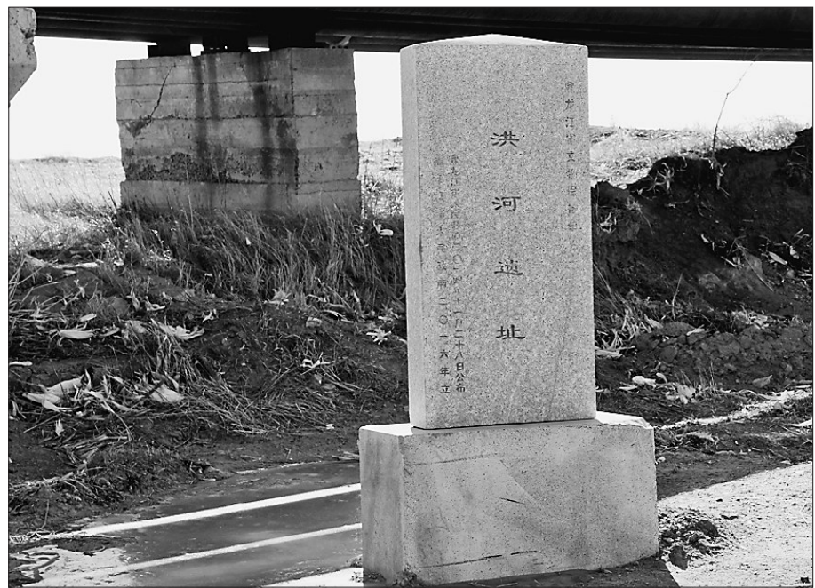
洪河遗址保护标志碑。