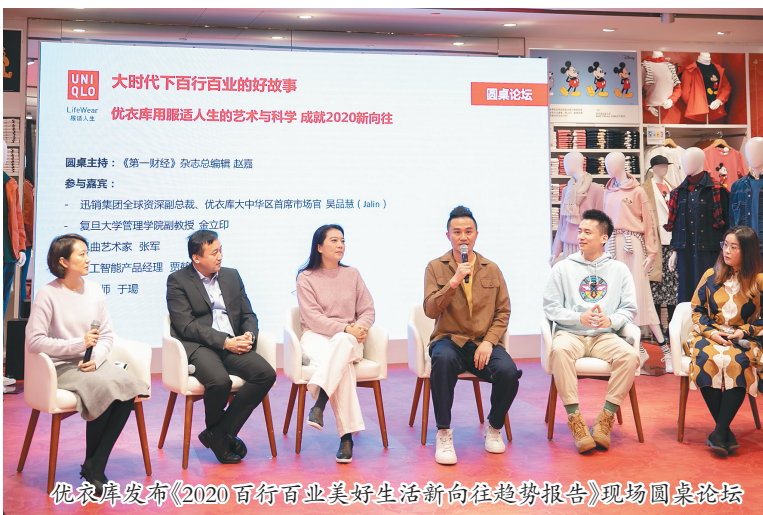
优衣库发布《2020百行百业美好生活新向往趋势报告》现场圆桌论坛

优衣库兼具科学功能与艺术设计、不断进化的新年新装,助力各行各业成就2020美好生活新向往。