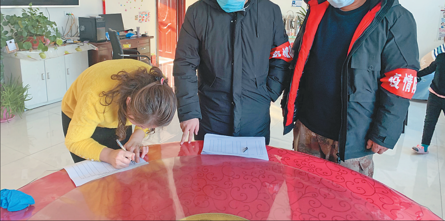
驻村干部入户排查。

在疫情防控关键期,新富村第一时间封控村屯各进出口,昼夜值班执勤守卫,严控车辆人员进出,拉网式入户排查登记,采取多种方式普及宣传政府公告和科学防疫知识。新富村党支部创新形式,丰富村民文化生活,组织的“乐享新富”歌唱比赛文艺活动第一季正在有声有色地开展,初赛、半决赛、决赛、总决赛分步实施,广大村民宅在家里展示才艺,乐此不疲。2月8日,初赛成功举行。第一批17名选手用手机录制歌曲,在微信群集中展示,用歌声表达防疫战役决心,对健康幸福生活的珍惜与守护。截至目前,人群村民超过500人。村党支部书记金洪亮说,虽然是手机微信群里比赛,也要有模有样,他们还邀请林甸县内著名主持人、演员、音乐教师在群里担任评委点评,组织全体村民进行投票评选,群众参与热情积极踊跃。通过展示精彩节目,唱出新富好声音,凝聚起村民众志成城共渡难关的精神力量。