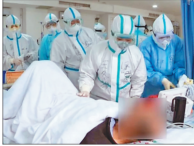
黑龙江省援应医疗队在工作中。