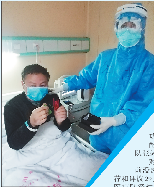
黑龙江省医院医护人员赠送患者小礼物。