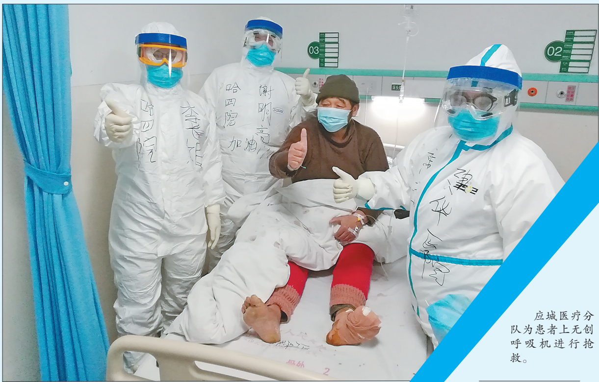
汉川医疗分队医护人员病房内为患者加油。

省医院呼吸科主任、孝感医疗专家组组长张敏,参与制定孝感市重症和危重症早期评估表,指导我省支援孝感医疗队将诊断治疗关口前移,降低重症和危重症发病率。医疗队通过规范治疗、MDT、精准救治、开展医护一体化查房、全流程感控管理、人文的心理护理、规范的诊治照护流程,重症救治取得良好效果。医疗队还对汉川人民医院护理团队进行培训,建立微信群,通过微信达到长期帮扶、技术支持。黑龙江省医院护理部及美学委员会还带来了手工制品,给每一个出院患者送上美好祝福。