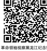
革命领袖视察黑龙江纪念馆全景VR