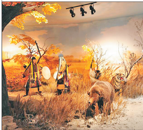
同江市赫哲族博物馆

公众号还推出“弘扬雷锋精神,共创和谐家园”——线上参观雷锋事迹图片展。图片展由《雷锋同志生平》《我把青春献给党》《雷锋精神永存》《我奉献我快乐》等部分组成,通过大量详实的图文资料,向人们生动地勾勒出一幅幅感人至深的画面,大力弘扬全心全意为人民服务的雷锋精神。