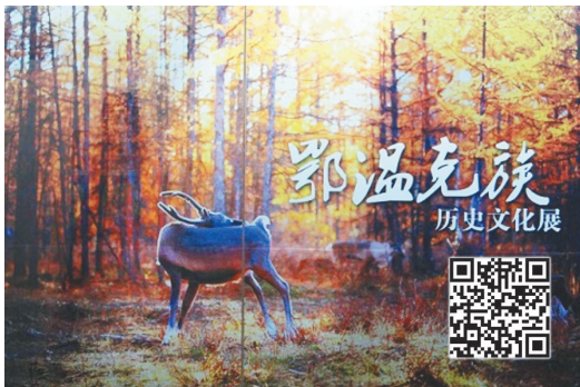
黑龙江省民族博物馆。

黑龙江传统渔猎文化陈列:展览分为“江河渔捕”“林海游猎”“桦皮神韵”“精神世界”四个部分,主要展示了黑龙江流域达斡尔族、鄂伦春族、赫哲族、鄂温克族四个渔猎民族狩猎、捕鱼等生产生活习俗和富有浓郁北方少数民族特色的鱼皮文化、桦树皮文化、兽皮文化和萨满文化等。