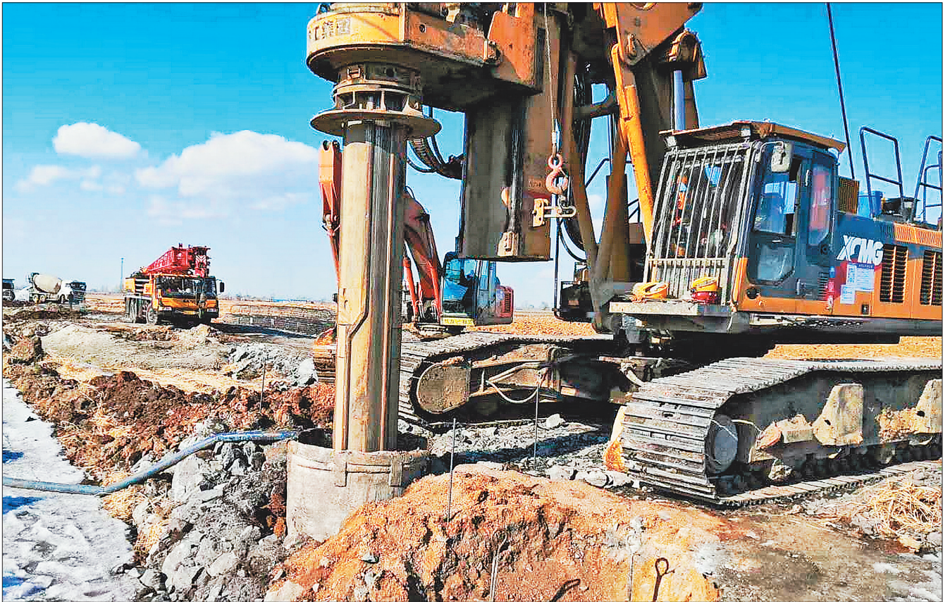
我省百大项目佳鹤铁路改造工程跨鹤大高速公路特大桥第一根桩基浇筑。

哈伊铁路全长299.17公里,时速250公里,项目总投资约305.08亿元,建成后 will 有效拓展东北高铁网辐射范围,加强北部边疆地区与内陆发达地区的经济联系,弥合地区间经济差距,打造区域经济增长的全新引擎。牡佳客专是我省东部城市群间的重要城际旅客运输通道,也是我省对外客运交通的骨干线路,全长375公里,时速250公里,总投资385.6亿元,建成后将与哈牡高铁、哈佳铁路共同构成我省东部地区快速铁路环线。