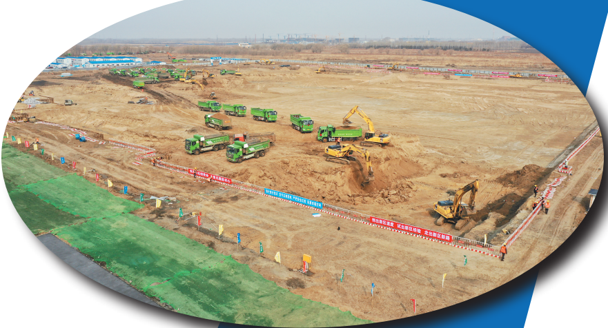
深哈产业园项目加快建设。