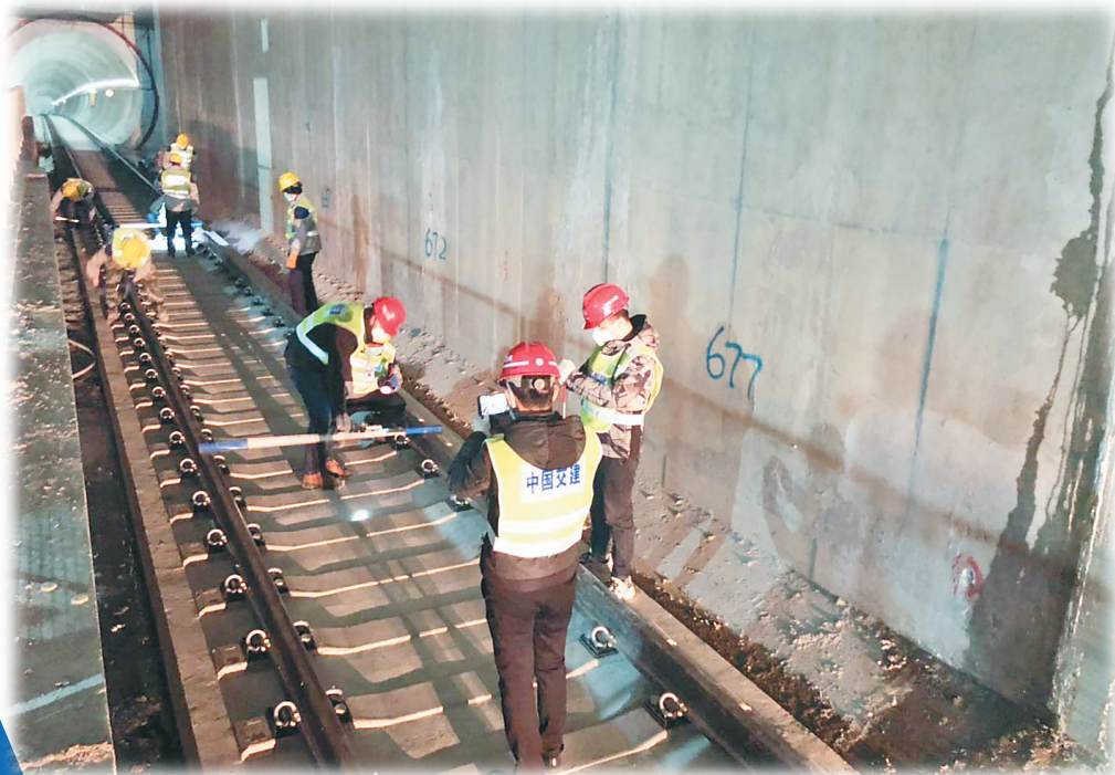
哈尔滨地铁建设现场。