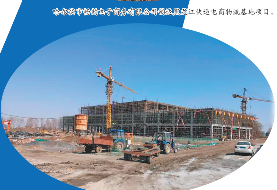
哈尔滨文裕物流有限公司家居建材仓储物流城项目。