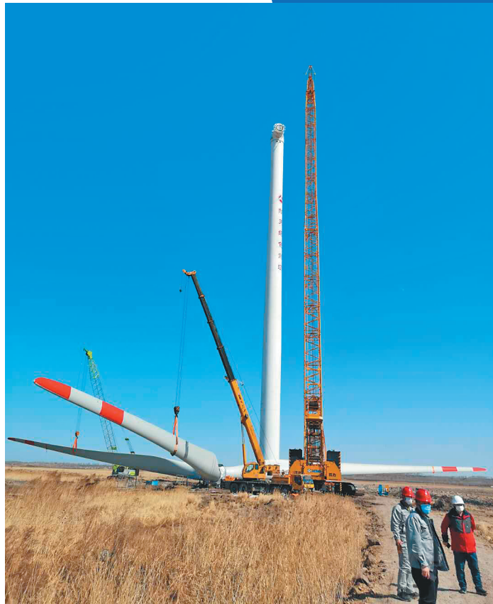
新天哈电新能源投资有限公司双城万隆49.5MW风电项目。