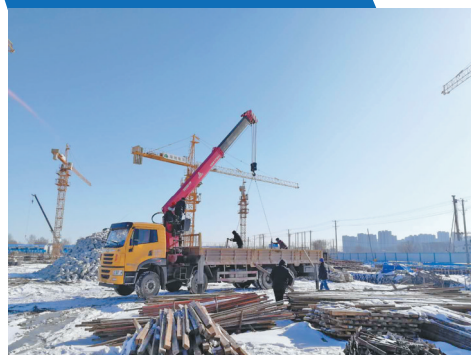
绿地·中央公园国际电竞项目。

统筹做好疫情防控和经济社会发展，既是一次大战，也是一次大考。面对前所未有的挑战，哈尔滨2020年省百大项目建设踏着春的脚步，写下了完美篇章。