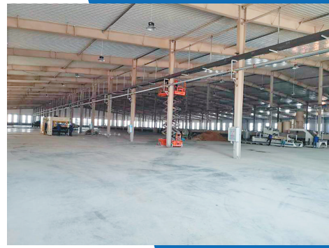
哈尔滨仲利包装制品有限公司包装材料二期项目。