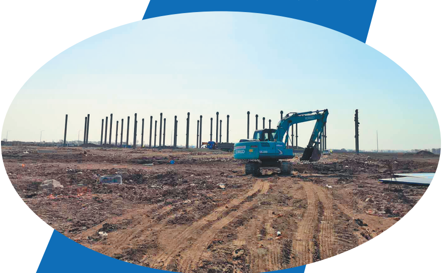
哈尔滨市协韵电子商务有限公司韵达黑龙江快递电商物流基地项目。