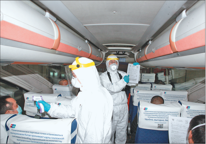
过境车辆内的宣传检测。