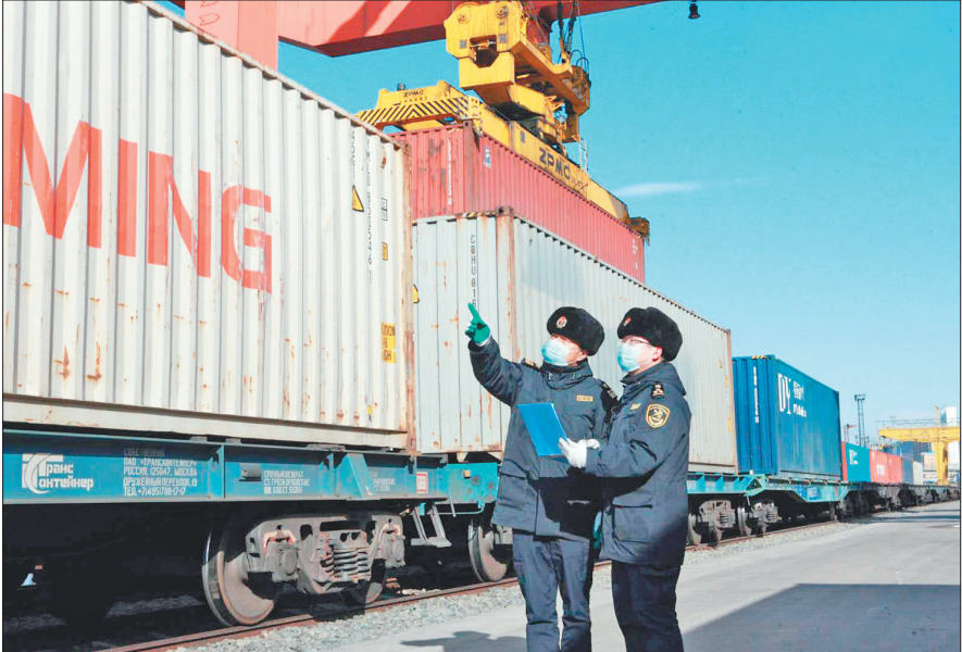
检验过境货品出关。