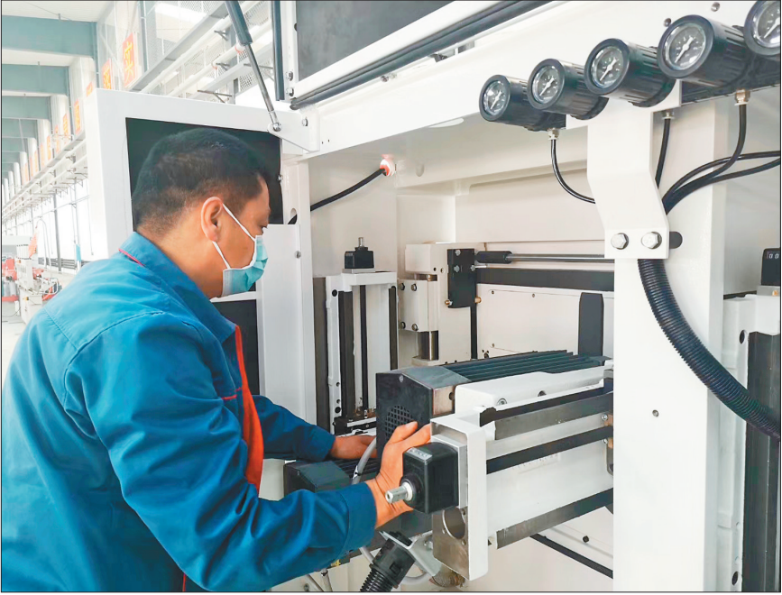
生产车间调试设备。