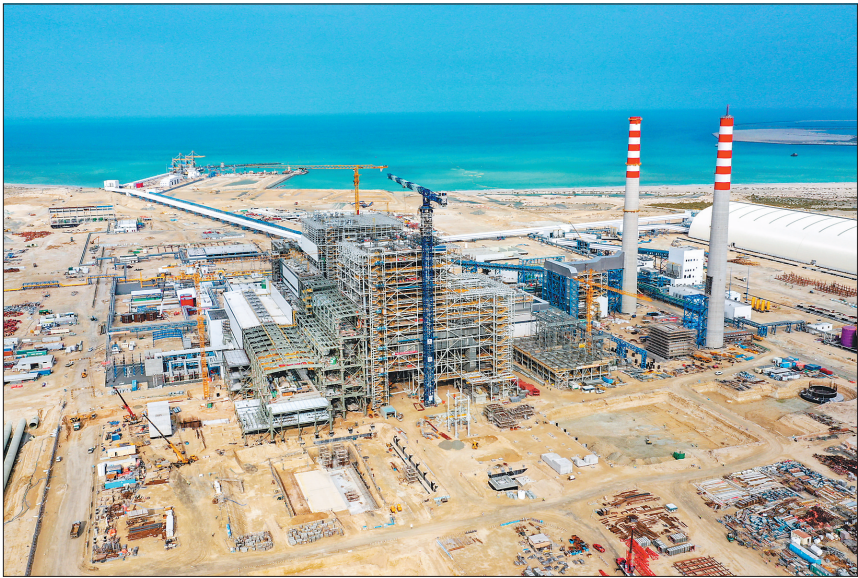
全世界第一台能实现双燃料均能满负荷供电的清洁燃煤电站——迪泽哈斯摩4×600MW清洁燃煤电站项目现场。