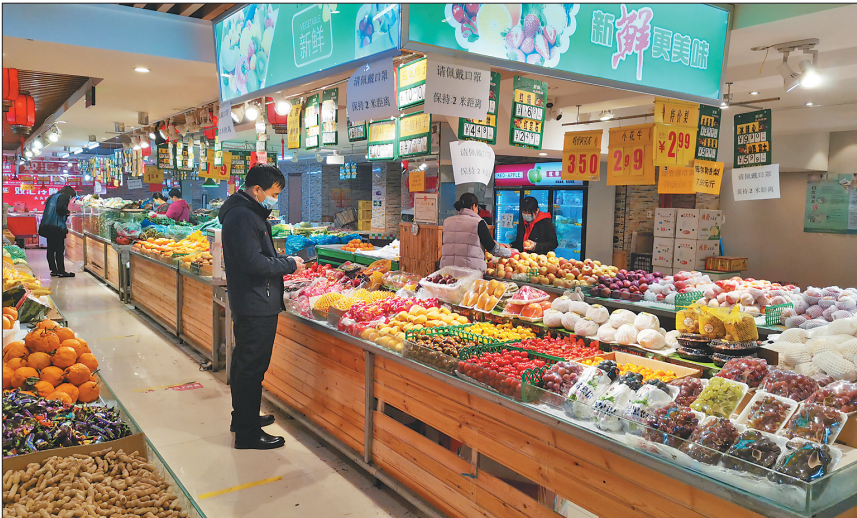
铁路街274—2号嘉源超市内顾客购物秩序井然,能自觉保持一定距离。