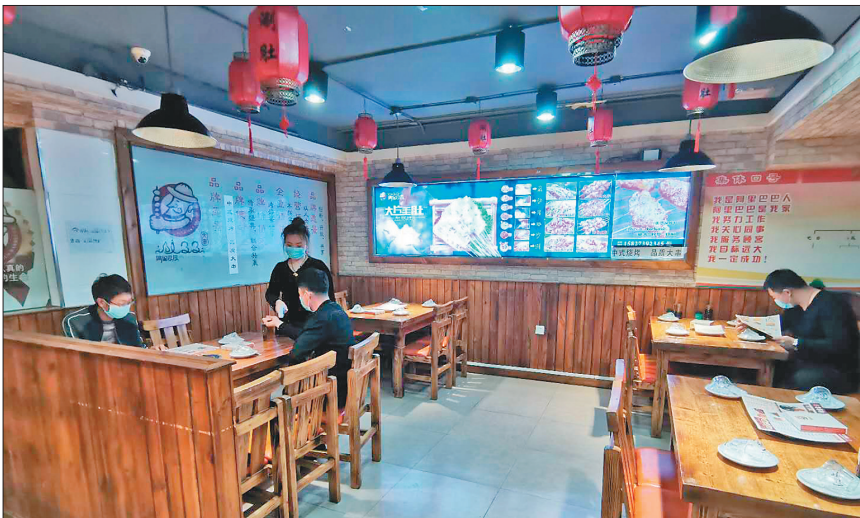
通达街269号阿里巴巴商店内,两桌顾客间隔一米以上。