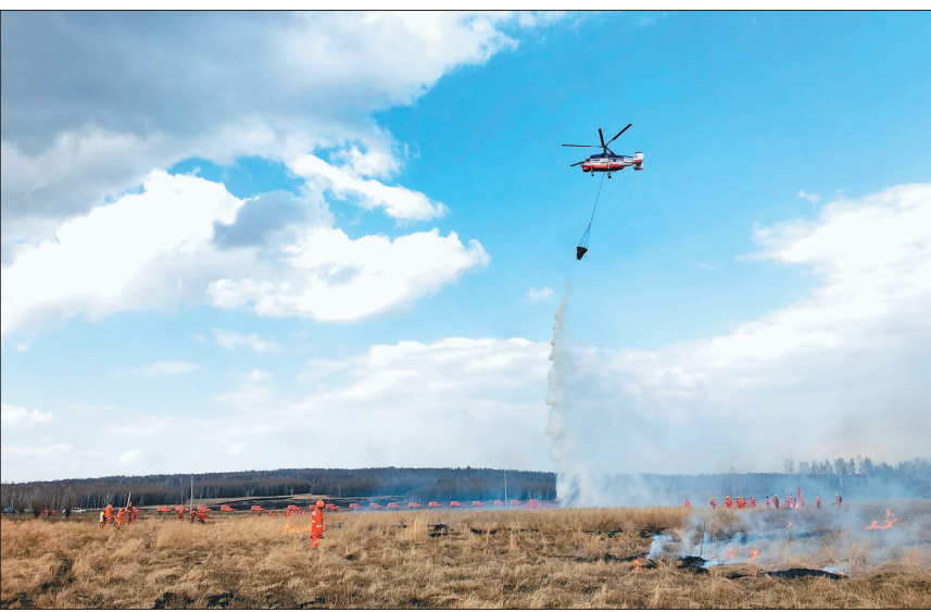
沾河林区防火演练,直升机吊桶灭火。