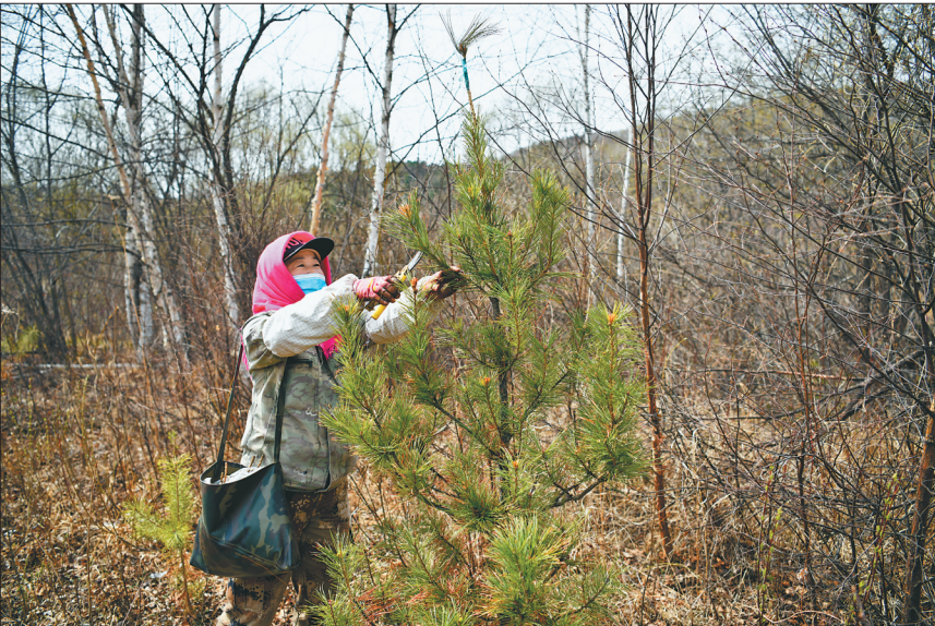
大海林林区嫁接苗木以提高结实量。

任务,即全面推进生态建设,把培育、保护和管理好森林资源作为集团首要任务;加快产业转型升级,积极发展资源好、投资少、见效快、就业多的产业项目和新业态;发挥林业投资功能,聚焦龙江林业产业和其他相关产业进行投资运营,加快推进资源资产化、资产资本化、资本证券化。