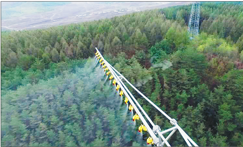
飞机喷雾作业防治病虫害。

据介绍,除了飞机防治病虫害,龙江森工集团还将与科研院所建立长期合作关系,定期开展技术培训,实现生产单位与科研院所的实时有效对接,及时指导防治工作。抓住最佳防治时机,采取有效措施,统一采购药品发放至落叶松毛虫和红松球果害虫发生面积较大、较重的单位,并予以适当资金补贴,积极开展松材线虫、美国白蛾等外来有害生物监测工作,确保龙江森工林区森林生态安全。