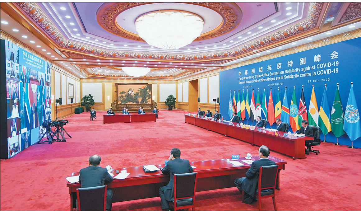
本次峰会由中国和非洲联盟轮值主席国南非、中非合作论坛共同主席国塞内加尔共同发起,以视频方式举行。