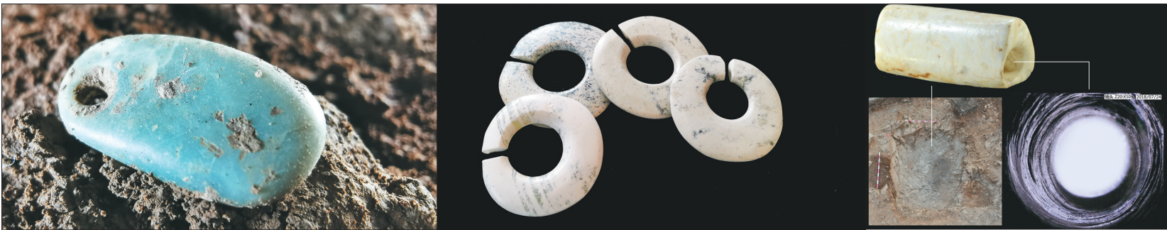
小南山出土的玉坠、玉玦及玉管的显微照片。