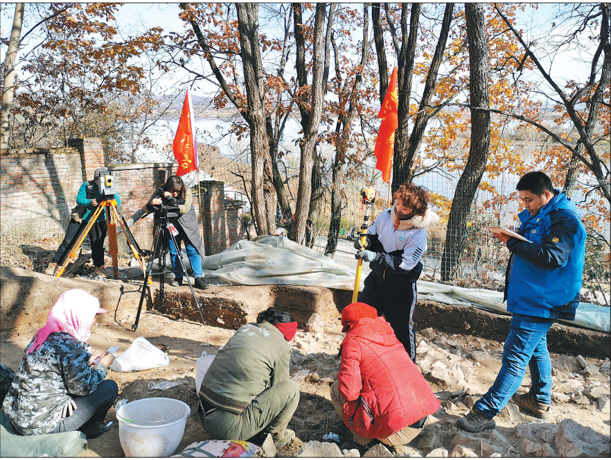
考古人员揭取封石堆过程中对全部石块三维坐标进行测量。