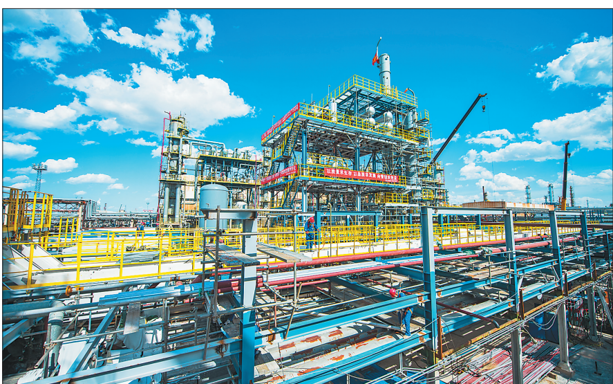
30万吨蜡加氢装置主反应器吊装作业现场。