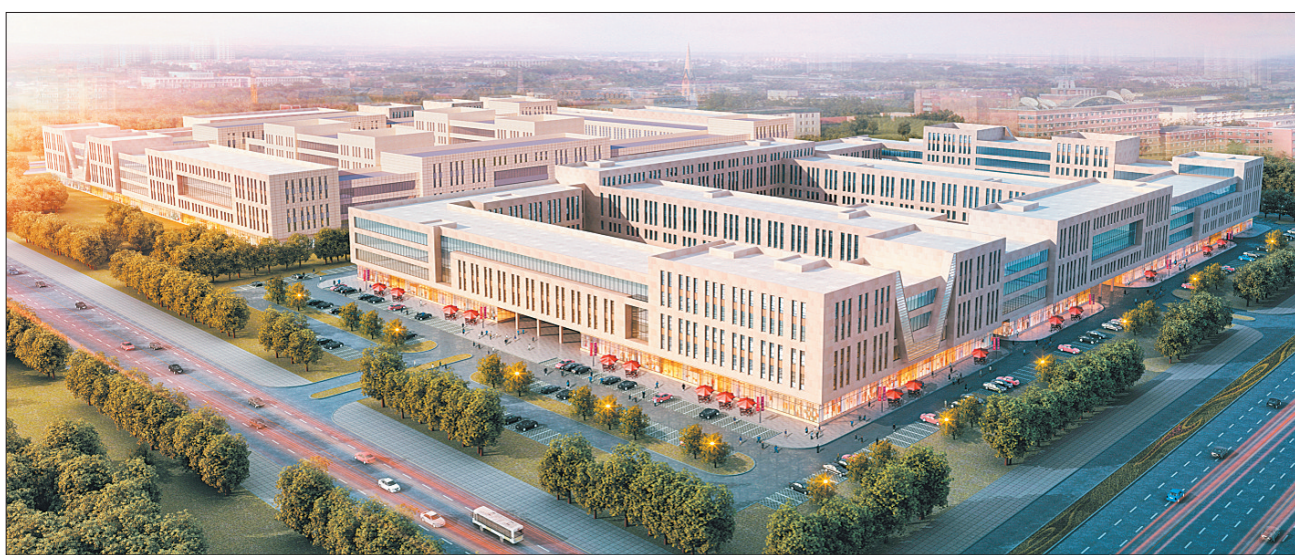
牡丹江经开区服务外包产业园鸟瞰图。