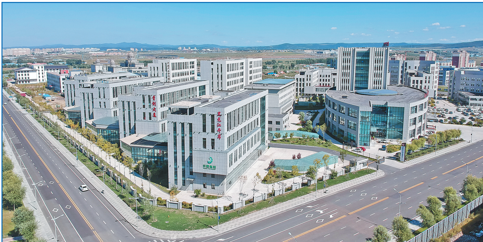
牡丹江经济技术开发区。

疫情防控不松懈、日常工作不松劲,该市营商环境建设监督局网上登记的便利化日常让工作效率提高,企业登记时间缩短,实现了企业网上登记系统“秒批”。今年,全市企业开办时间再提速,将原来的2个工作日压缩至1个工作日完成。截至目前,共办理企业网上登记7100户。牡丹江市相对集中行政许可权试点确立以来,大力推进行政审批领域改革,不断深化流程再造,推进简政放权,探索行政审批最优路径,改革经历了从“多次跑”到“最多跑一次”,再到“一次不用跑”的深刻蜕变。通过职能划转、集中进驻等措施,将分散在各职能部门、各服务大厅的行政审批职能,向行政审批局集中,向政务服务中心(涉企)、民生大厦集中,全力推动从“到处跑、多次跑”到“只进一扇门”、“最多跑一次”的变革,打造了行政审批改革1.0时代。在全省率先推行企业登记“一表制”,将关联度高的审批事项进行梳理整合,按照“一套材料、一表登记、一窗受理”的工作模式,减少或合并登记要件,细化“一次性告知单”,实现一表完成工商、质监、税务“一照三证”登记。率先在全国推行“四证合一”登记模式,实现向企业统一颁发加载注册号、组织机构代码、纳税人识别号、社会保险登记编码的“一照四码”的营业执照,企业审批时限由国家规定的7个工作日压缩至30分钟。在市行政审批中心(涉企)服务大厅、民生大厦均设立了审批事项综合服务窗口,统一推行“前台综合受理、后台分类审批、综合窗口出件”的综合办理模式。在建设项目审批综合窗口,抽调专人进驻,将工程建设审批前期工作启动到竣工验收涉及的全部审批事项纳入综合窗口牵头办理。将工程建设审批流程划分为项目立项用地规划许可、工程建设许可、施工许可、竣工验收四个阶段。其他行政许可、强制性评估、中介服务、市政公用服务以及备案等事项纳入相关阶段办理或相关阶段并行推进。在2019年投入使用的民生大厦中,针对医保、社保、公积金等政务服务事项也推行了综合办理模式,不动产窗口实现了2个工作日办结。