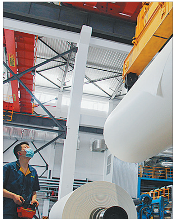
“恒丰纸业”保持有序发展势头。

牡丹江各县(市)区、市直产业招商专班通过网站、微信公众号、快手、微博、易企秀等方式,发布本区域、本产业的招商项目、区位优势、产业基础、生产要素等各类招商信息4189条,其中有针对性地面向1840家企业发布相关信息。截至5月31日,各县(市)区、市直产业招商专班聚焦发达地区产业和技术转移趋势,结合全市各地产业特点和企业发展需求,谋划包装招商项目2039个,包括亿元以上招商项目853个,其中能达到预可研项目255个。全市累计形成线索项目1531个,包括亿元以上线索项目466个。