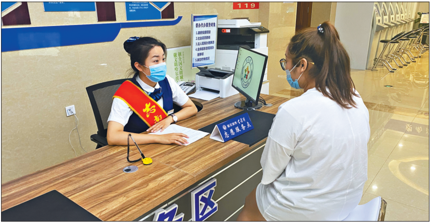
工作人员为企业办理相关事项。