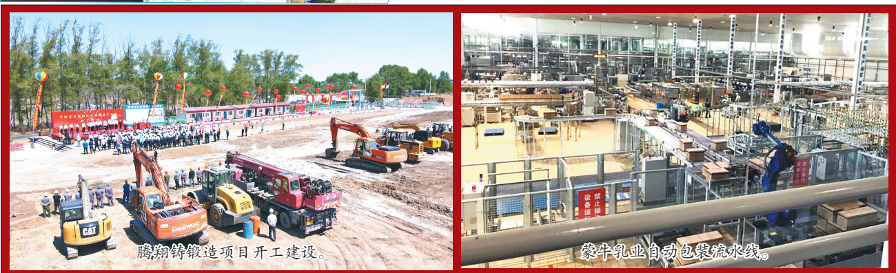
腾翔铸锻项目开工建设。

不谋全局者,不足以谋一域。今年经济工作怎么干,建华区掷地有声做出回答:“只争朝夕、不负韶华”。区委区政府积极克服疫情影响,坚持两条腿走路,在做好大项目基础上,将目光聚焦到现代服务业。在与沈阳坚果签约网红基地项目后,立即组建网红基地项目工作专班,全面包保推进。不断创新运营模式,开启区政府提供场地、沈阳坚果公司提供运维技术支持,齐齐哈尔巨力广告有限公司出资装修及日常运营的三方合作。截至目前,项目总投资1000万元,建筑面积2100平方米,设有席位105间,可实现就业500人。在网红创新创业基地项目带动下,总投资1000万元的宽加文化传媒网红基地项目完成签约,总投资1000万元从事网红基地代运营的北京大石数据项目,已落地建华区凤凰现代服务业孵化基地,助力打造具有齐市区域特色网红经济,推动区域经济高质量发展。