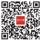
黑龙江日报 客户端