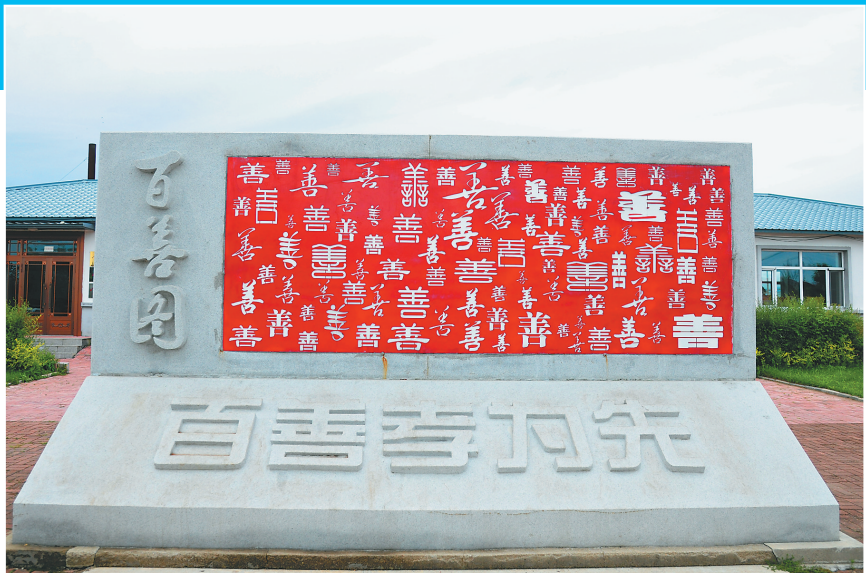
通河县通河镇桦树村以中华传统美德为基础,陆续修建了百善图等文化景观。