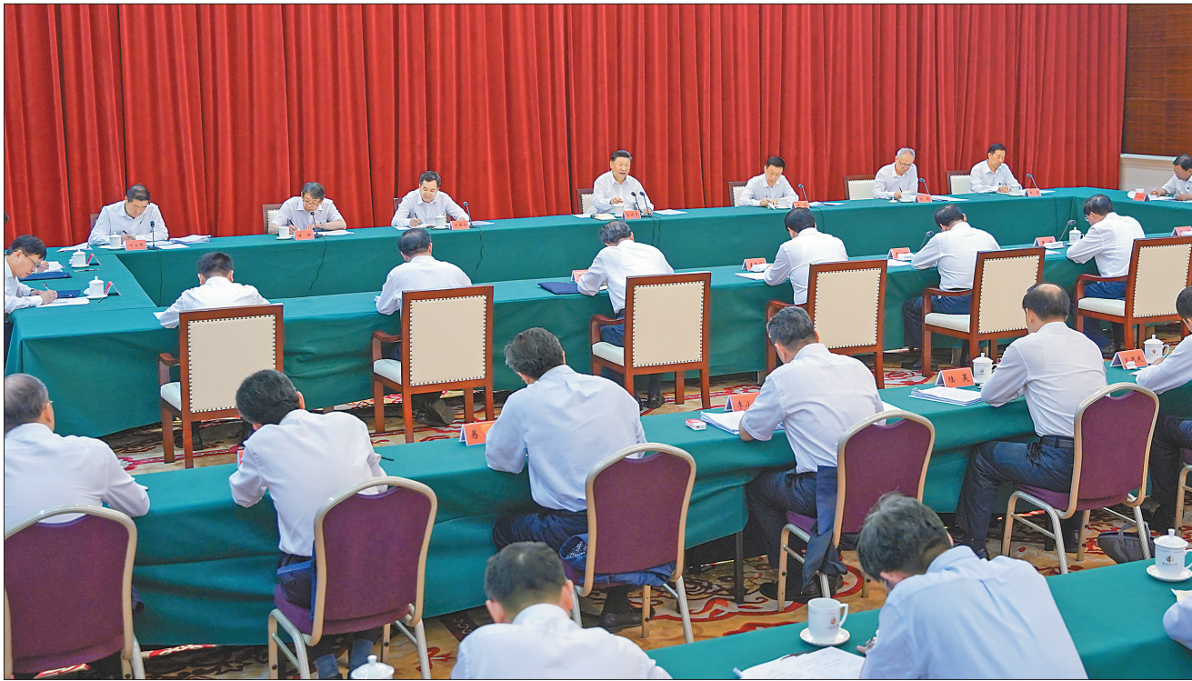
8月20日，中共中央总书记、国家主席、中央军委主席习近平在合肥主持召开扎实推进长三角一体化发展座谈会并发表重要讲话。

在听取大家发言后，习近平发表了重要讲话。他指出，长三角一体化发展战略实施一年多以来，三省一市和有关部门贯彻落实党中央决策部署，工作抓得紧，有不少亮点。一是对党中央战略意图领会到位，把长三角一体化发展放在国家区域发展总体战略全局中进行统筹谋划，扣紧了全国发展强劲活跃增长极、高质量发展样板区、率先基本实现现代化引领区、区域一体化发展示范区、改革开放新高地的战略定位。二是创新方式方法，围绕重点领域和重点区域进行突破，以点带面加快一体化进程。三是战略实施成果已经显现，规划政策体系“四梁八柱”初步构建，多层次工作机制发挥实效，在这次疫情防控 and 恢复经济过程中，一体化机制和互联互通基础设施发挥了作用。总的来说，长三角一体化发展新局面正在形成。这说明，党中央决策部署是正确的，各方面落