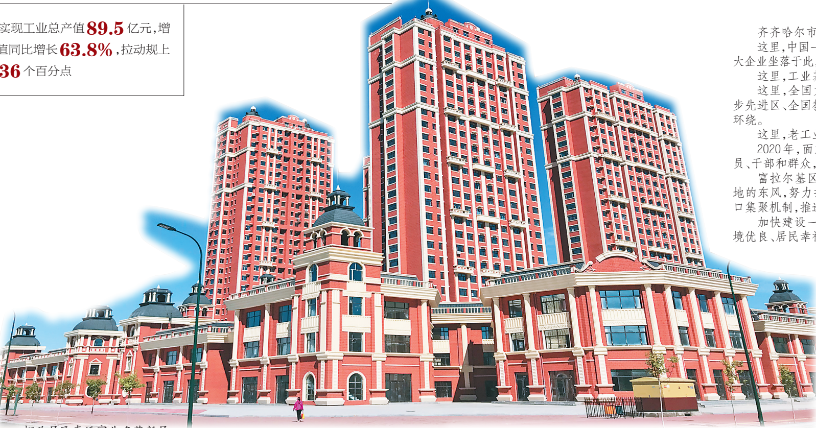
棚改居民喜迁富北名苑新居。