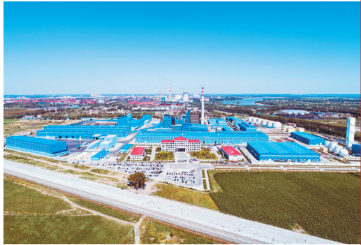
黑龙江紫金铜业厂区鸟瞰。