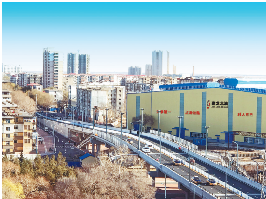
富江路跨线桥竣工通车。