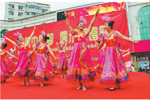
社区艺术节上群众载歌载舞。