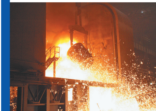
建龙北满一炼钢厂电炉生产场景。