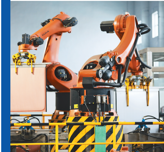
紫金铜业生产车间全自动化机械手正在抓取阴极板。