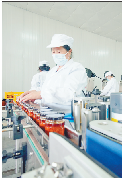
讷河的大球盖菇加工成罐头食品。