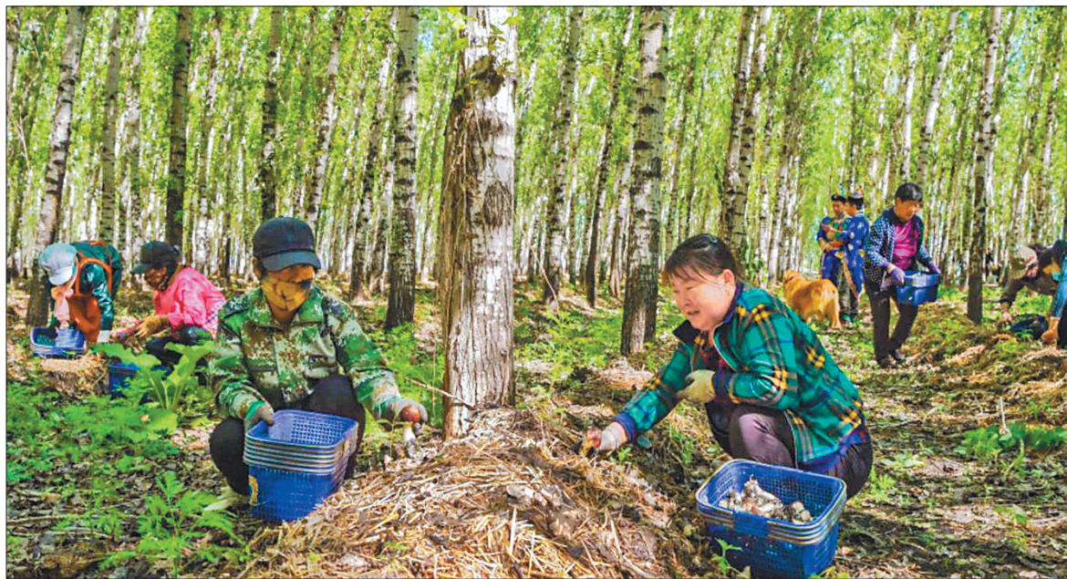
大片林地适宜赤松茸生产。