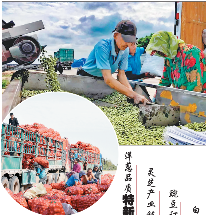
大八旗村豌豆、洋葱喜获丰收。