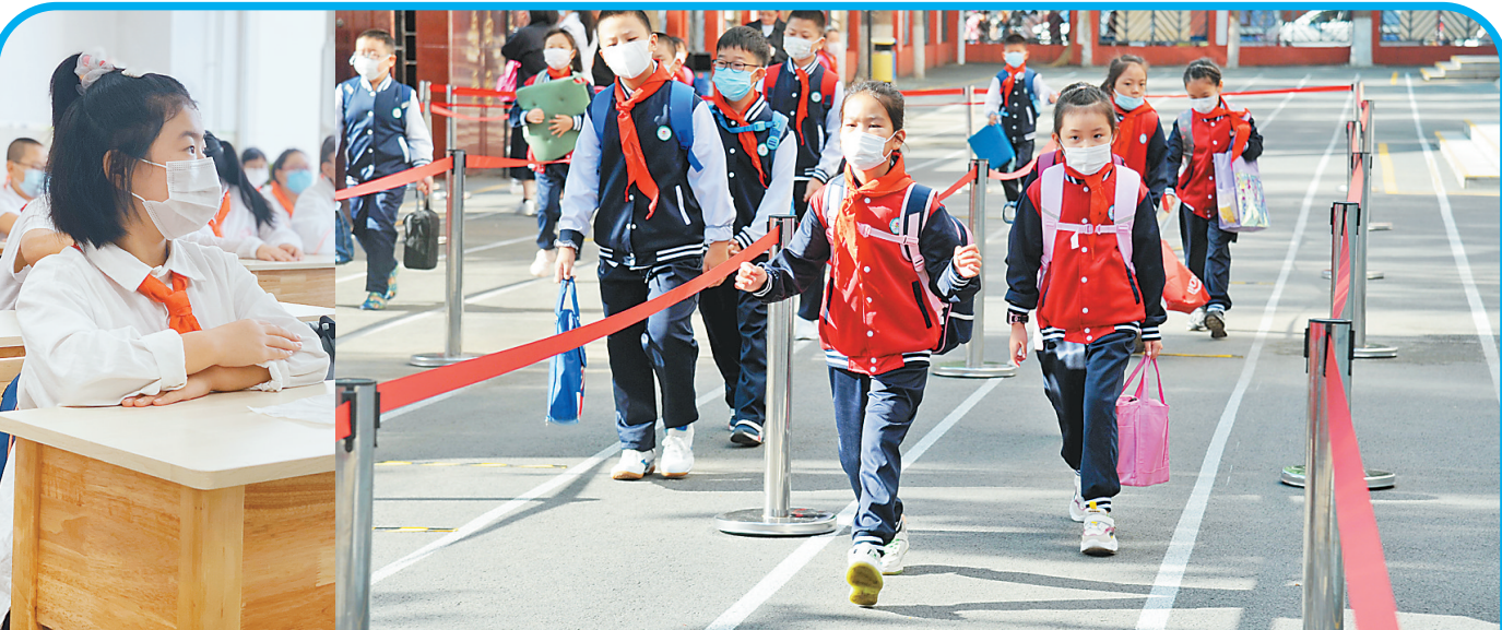
8月31日,是哈尔滨中小学校2020秋季学期开学的日子。开学前,哈市各个学校根据实际情况,

在新修订的《学籍细则》中,省教育厅对转学业务进行了规范。进一步明确了什么样的情况能转学,什么样的情况不能转学,什么样的学校不能接收转入学生,想转到民办学校该怎么办。