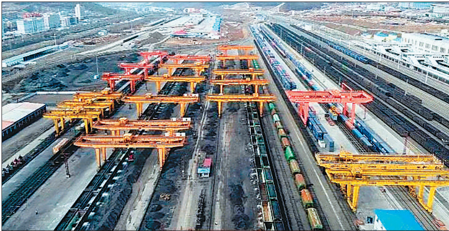
繁忙的绥芬河铁路口岸。

在绥芬河公路口岸,新国门巍峨耸立,登临国门,中俄两国风貌尽收眼底。如今,绥芬河铁路口岸全新升级,绥芬河