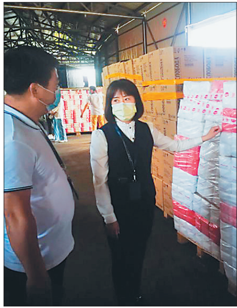
互贸区内的进口面粉很受边民欢迎。